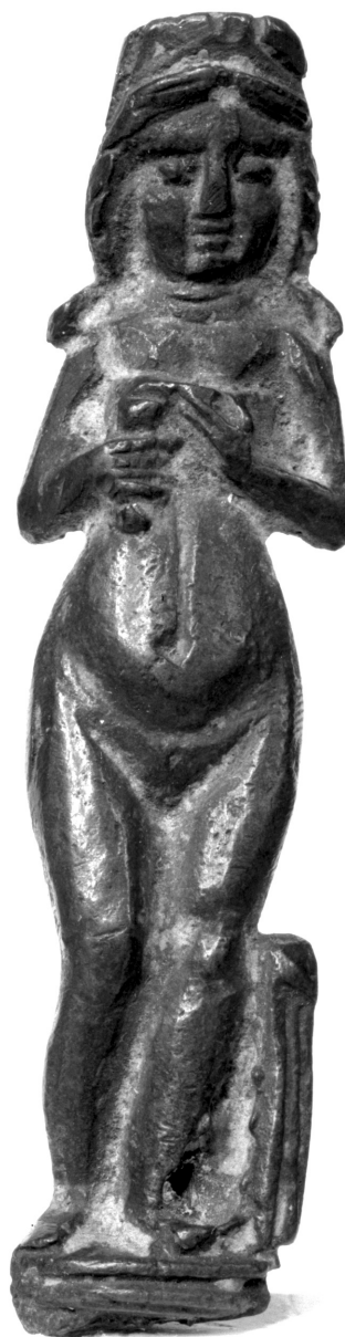
2. kép. Melle köré fascia pectoralis tekerő nőalak bronzból készült szobrocskája köldökétől felfelé hosszanti bevágás ábrázolásával (Belgrádi Nemzeti Múzeum)

A fent említett, az 1300 körüli évekre keltezhető ábrázolás a középkori és reneszánsz illusztrációk egy olyan népes és a