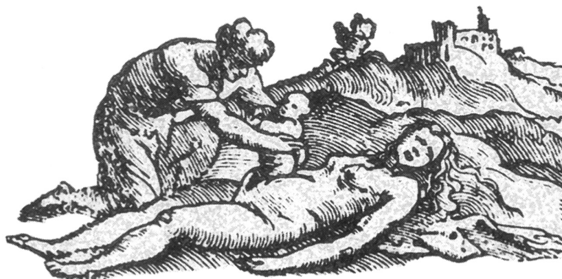
4. kép. Asclepius születését ábrázoló fametszet Alessandro Benedetti De re medica (1549) című művének borítójáról

A római társadalom elvárásai szerint a nők legfontosabb kötelességei közé a törvényes utódok kihordása és megszülése tartozott, mint ahogy a római házasság explicit célja is alap-