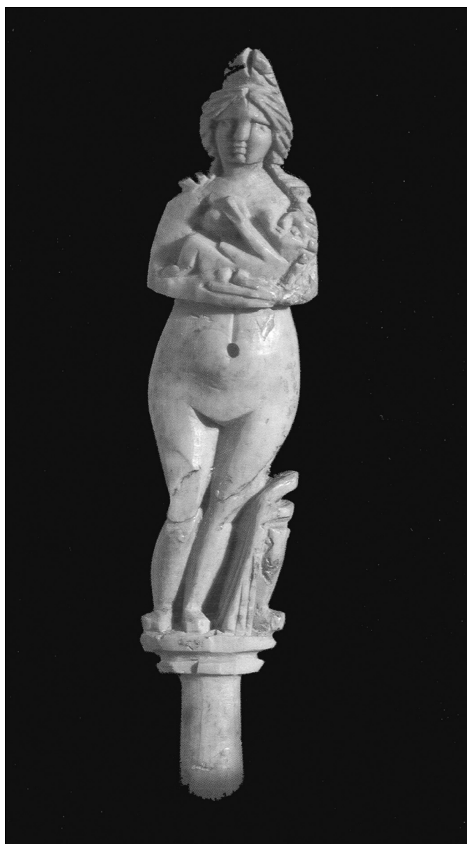
1. kép. Római kori guzsaly végét díszítő nőalak, köldökétől felfelé hosszanti bevágás ábrázolásával (ismeretlen lelőhelyről, ltsz. 54.66.13 és 15. Magyar Nemzeti Múzeum, Budapest)

Egy Kr. e. 2. évezredből származó babilóniai ékírásos táblát szokás a császarmetszés gyakorlatát egyértelműen bizonyító