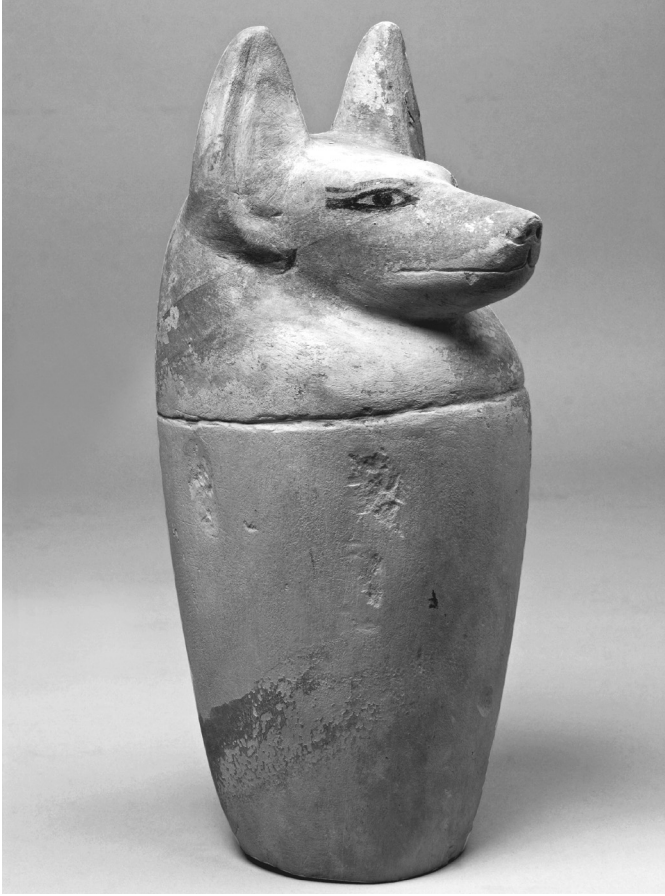
A halott belső szerveinek megőrzésére készült, mészkőből faragott kanópusz-edény a 22-26. dinasztia közötti időszakból (Kr. e. 9-7. század), a Khokha-domb 1. számú szaff-sírjának másodlagos újrafelhasználásakor készült aknasír-ból (Mátyus László felvétele)

kifeszített hosszú lepel vezette a tekintetet a közepén ülő szoborcsoporthoz, melynek elhelyezése és a bejáratról a szobor háttámlájáig vezető lepel ötletesen idézte fel az eredeti környezetet, a sír hosszanti folyosóját. Dzsehutimesz szobra nyilván azért is került a középpontba, mert épp ez a sír volt az, ahol a kiállításon bemutatott kutatási projektek jó pár évvel ezelőtt kezdetüket vették.