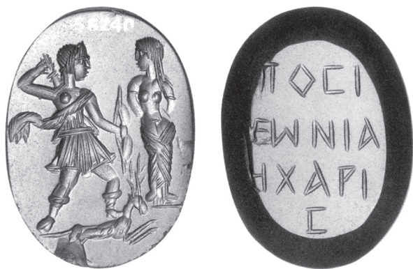
2. kép. Artemist és Aphroditét ábrázoló Kr. u. 2. századi varázsgemma a British Museumból (EA 56240). A hátoldali görög felirat: „A férj számára örök a gyönyör.”

gyakorlás minden egyes nap! Odaálltam a főnököm elé, és mondtam, hogy szeretném kivenni mind a négy hét fizetett szabadságomat, és kérnék még négy hét fizetés nélküli szabadságot is, de ő ragaszkodott, hogy nyolc hét fizetett szabadságot kapjak! Meglepetésemre közölte, hogy ő is tanult görögül, a Columbia Egyetemen diplomázott a harmincas években. Ez volt az ajándéka számomra. Később elmondta, hogy nagyon megörült, amikor megtudta, hogy egy fiatalember minden összespórolt szabadságát arra használja, hogy ógörögül tanuljon.