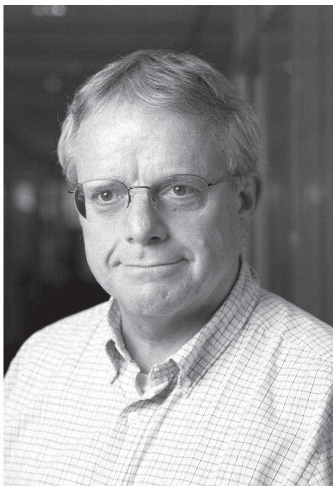
1. kép. Christopher A. Faraone

C. A. Faraone (1955) a Chicagói Egyetem Ókortudományi Intézetének (Department of Classics) professzora. Fő kutatási területe az ókori görög költészet, vallás és mágia. Az elmúlt években többször is járt hazánkban, hogy előadásokat tartson az ELTE Ókortörténeti Tanszékének és a Szépművészeti Múzeum Antik Osztályának meghívására. Bajnok Dániel egy ilyen látogatása alkalmával beszélgetett vele. 1