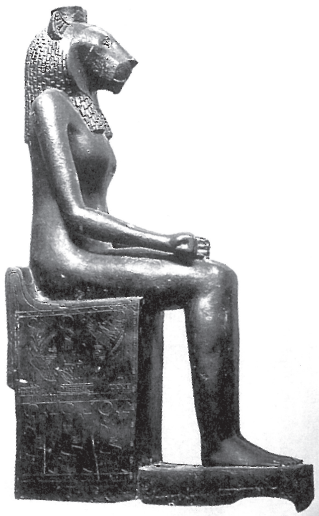
5. kép. Uadzet istennő szobra, Egyiptomi Múzeum, Kairó CG 39127 (Daressy 1905–1906 nyomán)