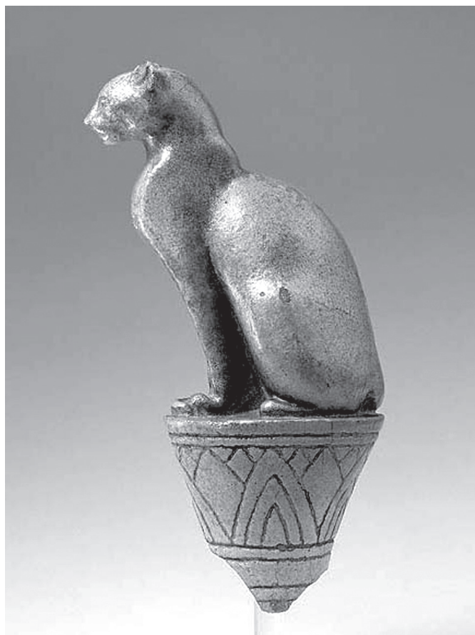
10. kép. Lótuson ülő macskát ábrázoló terrakotta (Ortiz 1996 nyomán)