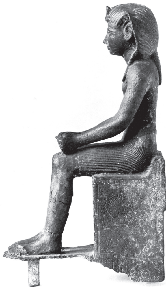
4. kép. II. Oszorkon (?) szobra (Schlögl 1978 nyomán)