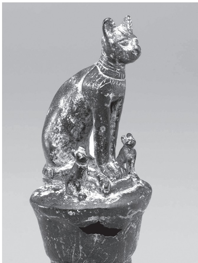
9. kép. Lótuszoszlopon ülő Básttet istennő szobra