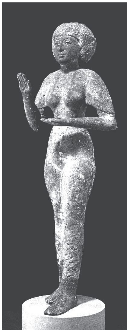
1. kép. A British Museum EA 43373. leltári számú szobra a Maat -felajánlásának gesztusával

Az egyiptomi fémszobrászat kiemelkedő darabjai közé tartoznak azok a női bronzszobrok, amelyek többsége a Harmadik Átmeneti Kor (Kr. e. 1069–664) időszakára keltezhető. Az egységes csoportot alkotó szobrokat olyan stilisztikai jegyek kötik össze, mint hajviselet, ruházat és testalkat. Legtöbbjük rituális cselekedet végrehajtása közben jeleníti meg az ábrázolt személyt (1. kép). A szobrok mérete 34–90 cm között változik. 1 A készítésükhöz felhasznált értékes nyersanyagok, nagy méretük, ábrázolt gesztusaik, az öltözék és hajviselet alapján a szobrok többsége az istenfeleségekhez és legszűkebb környezetükhöz köthető. 2