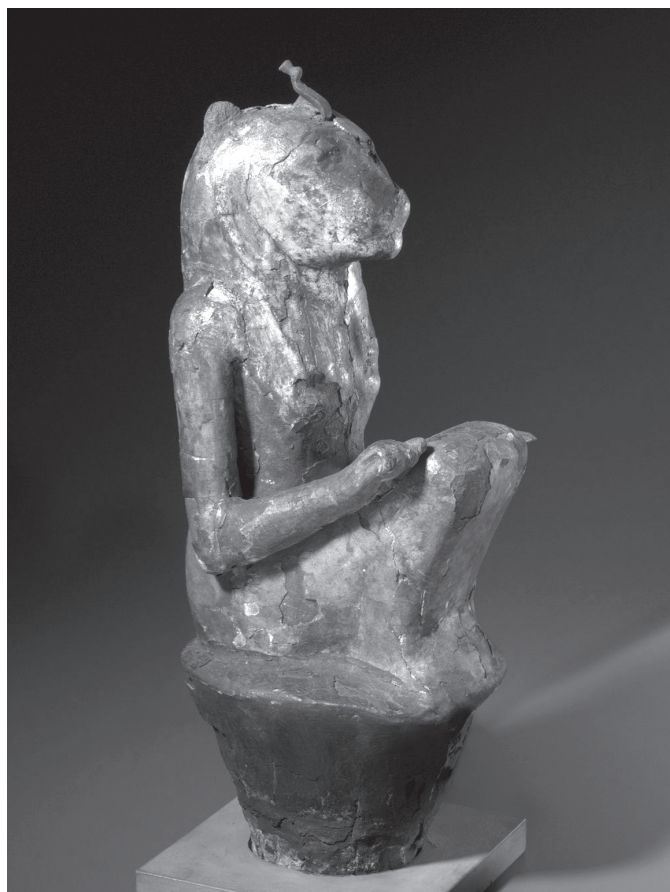
7. kép. Oroszlánfejű istennő szobra

Az éjjelre alámerülő és reggel újra a víz színe fölé emelkedő kék lótuszvirág az ókori egyiptomi kozmogóniában szorosan kapcsolódik a napistenhez, aki az Ősvízből felbukkanó lótusz kelyhében jelenik meg. 37 A szobor trónusán ábrázolt istennő lótuszon ül, fejét napkorong koronázza. Alakját mindkét elem a napistenhez köti. Az istennő a Napszemmel, a napisten lányával és védelmezőjével azonosítható, akit az egyiptomi ikonográfiában gyakran nőstényoroszlán alakban ábrázoltak. Ré napisten leányát számos egyiptomi istennővel, többek között Hathor, Szahmet, Bászdet, Tefnut, Mut és Ízisz alakjával azonosították. 38 Kiemelkedik közülük Bászdet alakja, akinek szintén ismert lótuszvirágon ülő ábrázolása.