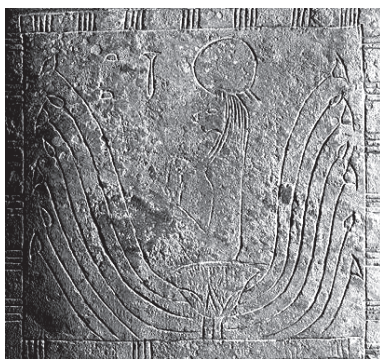
6. kép. Uadzset istennő lótuszvirágon ülő ábrázolása

A négy szobor közül kettő (ÄM 11867, ÄM 11867) bizonyosan Uadzset istennő számára felajánlott áldozati ajándék