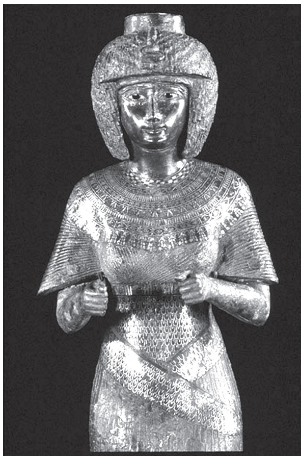
12. kép. Karomama G szobra, Louvre N 500