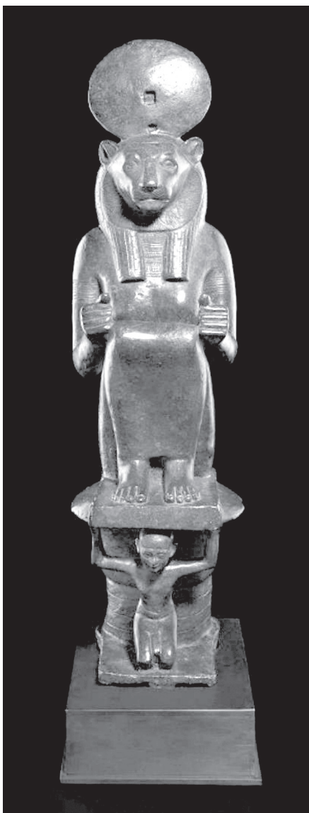
8. kép. Oroszlánfejű istennő szobra ( http://bit.ly/1Zpw2Tl )

A Harmadik Átmeneti Korban Básztet kultusza szintén nagy jelentőséggel bír. A líbiai származású uralkodók nagyszabású építkezésekkel bővítették a bubasztiszi templomkörzetet. 50 A város felvirágzásához nagyban hozzájárult kedvező földrajzi fekvése, amely bekapcsolta a települést a Mediterráneummal és a Szinájjal folytatott kereskedelembe. 51 A 22. dinasztia időszakában Básztet kultusza ismét fontos szerepet töltött be a király-ideológiában és a líbiai származású uralkodók legitímációjában. 52 I. Oszorkon bubasztiszi templomfelirataiban az