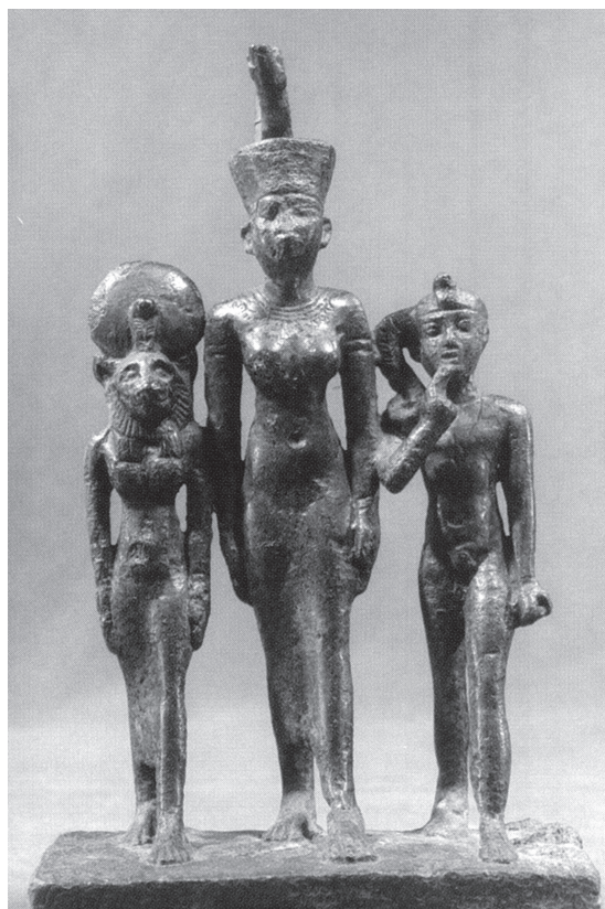
15. kép. Triász Néith, Harpokratész és a Napszem alakjával (Royal-Athena Galleries XIII [2002] 63, 171. kép nyomán)

A korábban bemutatott, lótuszvirágon/papiruszsáson ülő istenek ábrázolásával díszített bronzszobrok esetében a trónus mindkét oldalát vagy azonos dekoráció díszíti, vagy pedig egymást kiegészítő, közösen egységet alkotó ikonográfiai elemeket helyeztek el rajtuk. Ha kilépünk a lótuszvirágon ülő oroszlánfejű istennő ábrázolásait tartalmazó szoborkorpuszból, akkor ez a kép tovább erősödik, és a jelenség más 26. dinasztia kori példák esetében is megfigyelhető. 75 A Mallon-szobor trónusán a lótuszon ülő istennő ábrázolását tartalmazó bal oldali képmező ellenpárján, a trón jobb oldalán csak Amaszisz tollakkal díszített kartusai ismerhetők fel. A két névgyűrű azonos oldalon történő elhelyezése szintén szokatlan. A születési és trónnevet tartalmazó kartusokat vagy a trón oldalain találjuk – egyiket jobbról, másikat balról – vagy pedig mindkettőt a trón hátoldalán. 76 A hátoldal felső képmezőjének egykori dekorációja a korábban ismertetett példák alapján a