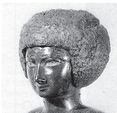
11. kép. Magángyűjteménybe került szobor (Delange et al. 1998 nyomán)

A párhuzamként rendelkezésre álló női bronzok közül a Mallon-szobor (2. kép)