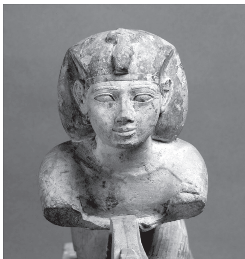
14. kép. III. Oszorkon szobra, Egyiptomi Múzeum, Kairó CG 42197 ( http://www.ifao.egnet.net/bases/cache/?descr=Statue&dat=TPI&os=87 )

Néith istennő azonban nem csupán Szaiszhoz kötődik, hanem ő a líbiai származású 22. dinasztia patrónusa is. Ősi istenként a teremtő istenek közé tartozik. A korábban ismertetett kispasztikák egy Harpokratész-pár társaságában ábrázolják. A szobrokat és Néith szerepét más kontextusba helyezi az a triáoszt ábrázoló kispasztika, amelyen Néith közepén álló alakját egy orosz-