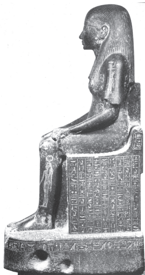
13. kép. Sebenszopdet szobra, Egyiptomi Múzeum, Kairó CG 42228 (Jansen-Winkeln 1985, Taf. 38 nyomán)

időszakára datálható. Ezért érdemes közelebbről megvizsgálni annak lehetőségét, hogy a szobor talán uzurpált. 73