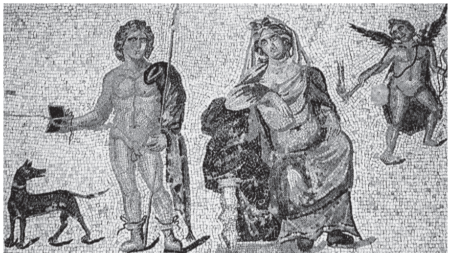
3. kép. Mozaik Nea Paphosból, Dionysos házából: Hippolytos, Phaidra, Erós. Kr. u. 250–300

A mitikus történet három főszereplőjét a déli óra három különböző állapotváltozásra és cselekvésre kényszeríti. Az eddigiekben arra mutattam rá, hogy a főnév jelentésében rejlő