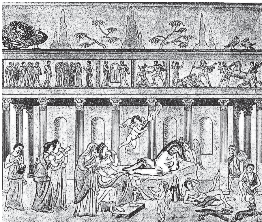
1. kép. Paul Friedländer rekonstrukciós rajza a bal oldali, nagyobb képpanelről, Balbina Bäbler módosításával (Théseus kéztartásának pontosítása)

Théseus álomba merülése tehát a forrósággal magyarázható, teszi egyértelművé a beszélő. 10 Phaidra viselkedése, jóllehet nem mondja ki expressis verbis , szintén összefüggésbe hozható a nap perzselésével. A hőmérséklet különböző fiziológiai változásokat idéz elő a férfiakban és a nőkben, s ezt a megismerés, isteni alakok jelenléte is nyomatékosítja. A déli sziesztáját töltő athéni király mögött Hypnos támaszkodik a klinére , a mellette ülő Phaidrát pedig két Erős igézi meg. Az Álom és a Szerelem a házaspár köré csoportosuló szolgálókban is ugyanazt a nemüknek megfelelő fizikai állapotváltozást eredményezi. Az athéni király férfi szolgálói elálmósodnak, az asszony szolgálólányai ellenben kíváncsian leskelődnek, élénken gesztikulálnak, a maguk alárendelt módján és titkolózva, de mély azonosulással osztoznak úrnőjük érzelmeiben. A képzet, hogy a nemek eltérő vérmérséklete különösen a tikkasz-