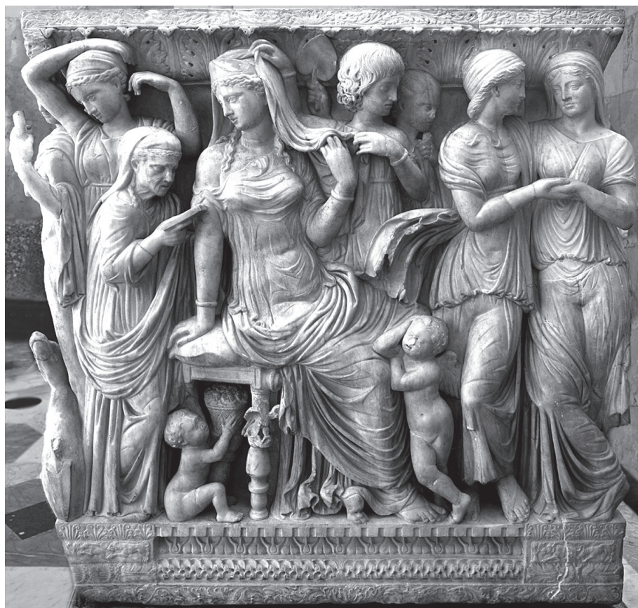
2. kép. Attikai márványszarkofág rövid oldala: Phaidra átadja a levelet a dajkának, alatta két Erős-figura. Kr. u. 225–250 k., Via Aurelia

Az athéni király ekkor már nem az ifjú, híres kalandor, egyáltalán nem vonzó – felesége számára legalábbis. 15 Díszes, arany chiton ja alól áttetszik bőrének fehérsége, ami – minthogy a napon tevékenykedő ifjak barnasága sokkal tetszetősebb – egyenesen undort ébreszt a mellette ülő Phaidrában (βδελύττεται, 12/114). Testhelyzete az alvók önkéntelen pózát idézi: egyik kezét tarkója alá támasztja, térdét fölhúzza nyúlik el az ágyon – a pathos minden porcikáját áthatja (12/117–121).