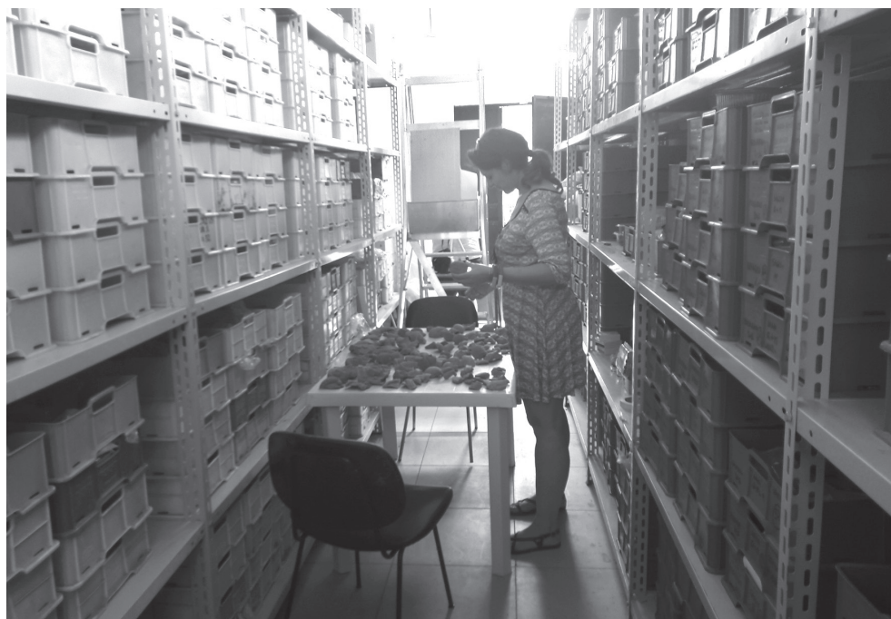
2.1. Medmai terrakották és restaurátoruk a rosarnói Museo Archeologico raktárában

Az alábbiakban négy tárgy példáján keresztül mutatom be a medmai terrakotta szobrocskák (új) restaurálása során felmerült problémákat és megoldásokat.