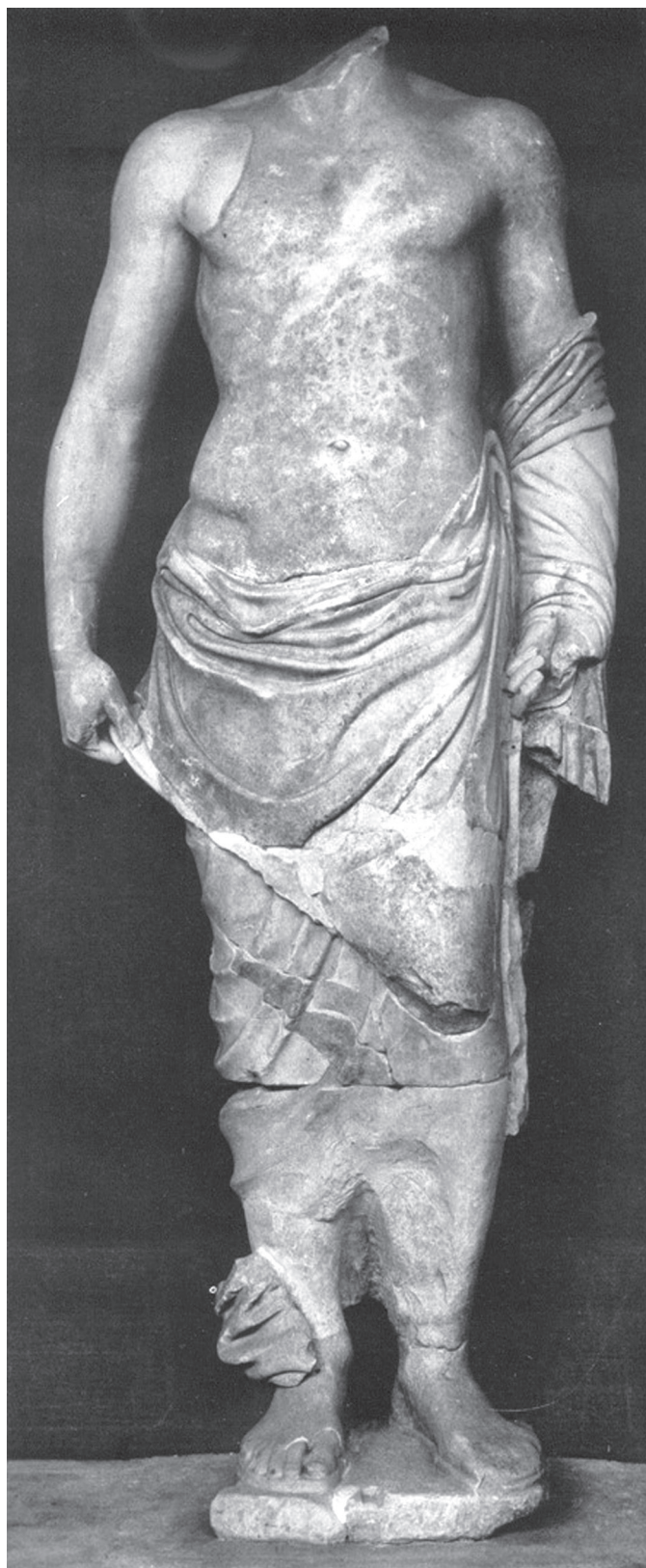
1.8. Zeus alakja az olympiai Zeus-templom keleti oromzatáról (Ashmole–Yalouris 1976, pl. 14 nyomán)