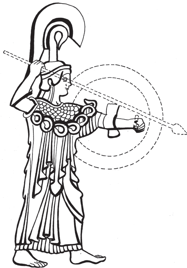
1.2. Athéna Promachos, rekonstrukciós rajz a Kr. e. 5. század elején készült ábrázolások alapján (Szabó Krisztina rajza)