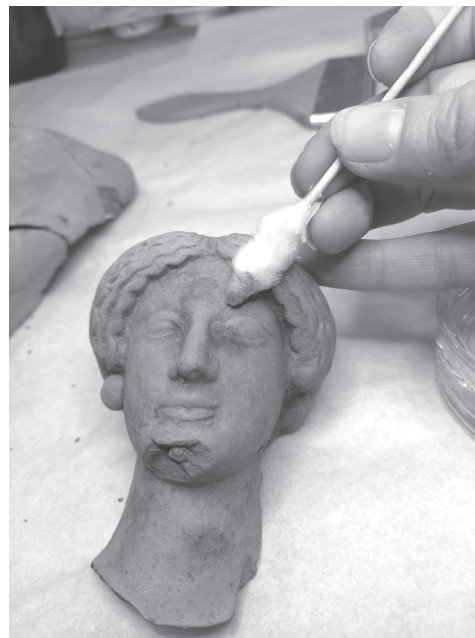
2.10–12. A rosarnói Mus. Arch. 3038+10729 sz. terrakottaszobrocskájának restaurálása

3. Álló nőalak (Itsz. 3038+10729), magasság: 396 mm Restaurátor: Rostás Zita 2.10–12. kép