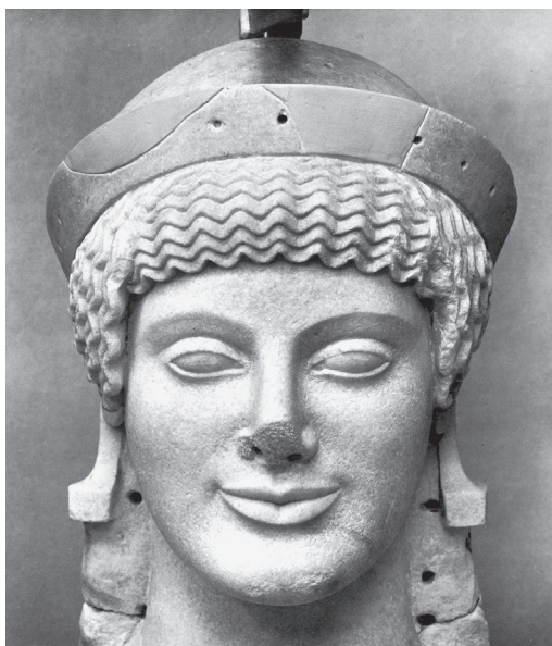
1.5. Athéné feje az aiginai Aphaia-templom nyugati oromzatáról (Ohly 1976/2011, Bd. 2–3, Taf. 77 nyomán)

Az álló nőalak (1.7. kép) a medmai repertoár egy másik, sokszor látott témáját, az álló, köpenyes hajadon alakját fogalmazza meg, egy kicsit másképp, mint közvetlen elődei. Leginkább figyelemre méltó részlete a test nagy részét beburkoló