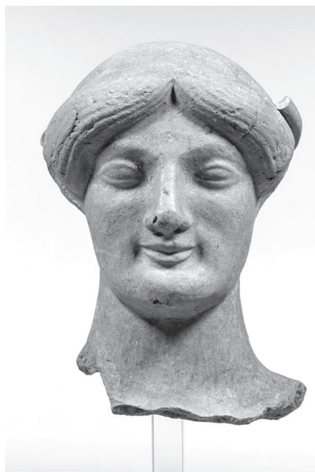
1.4. Női fej nagyméretű büsztről, Medmából, Rosarno, Museo Archeologico, inv. 1120