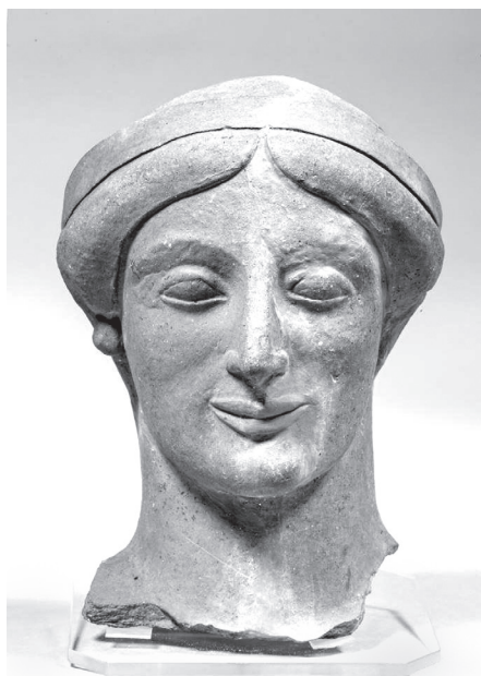
1.3. Női fej nagyméretű büsztről, Medmából, Rosarno, Museo Archeologico, inv. 2903