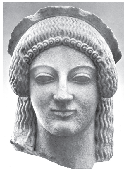
1.6. Akrotérion-alak feje az aiginai Aphaia-templomról (Ohly 1976/2011, Bd. 2–3, Taf. 222 nyomán)