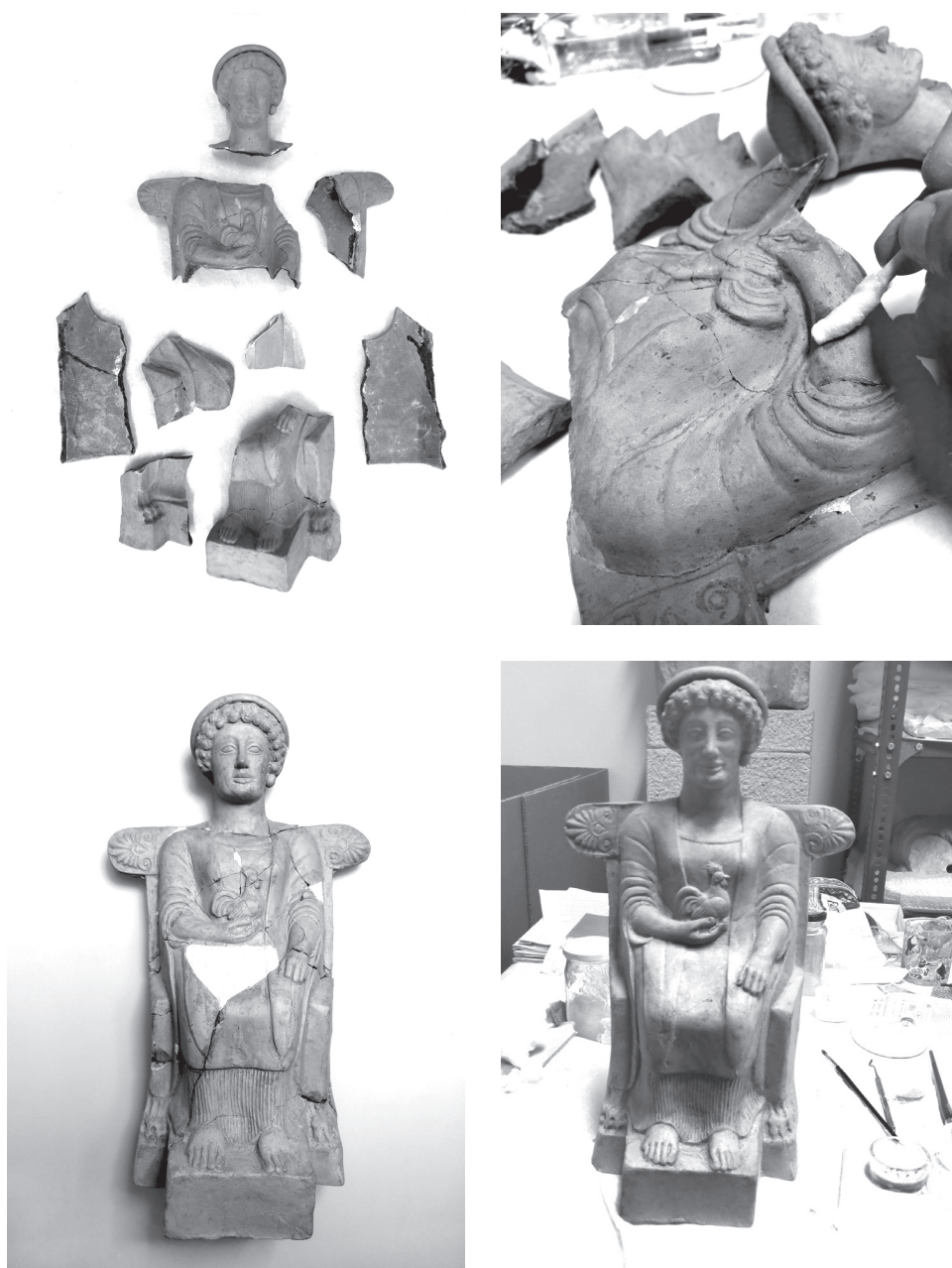
2.6–9. A rosarnói Mus. Arch. 1126 sz. terrakottaszobrocskájának restaurálása

2. Trónon ülő nőalak (Rosarno, Museo Archeologico, ltsz. 1126), magasság: 396 mm Restaurátor: Rostás Zita 2.6–9. kép