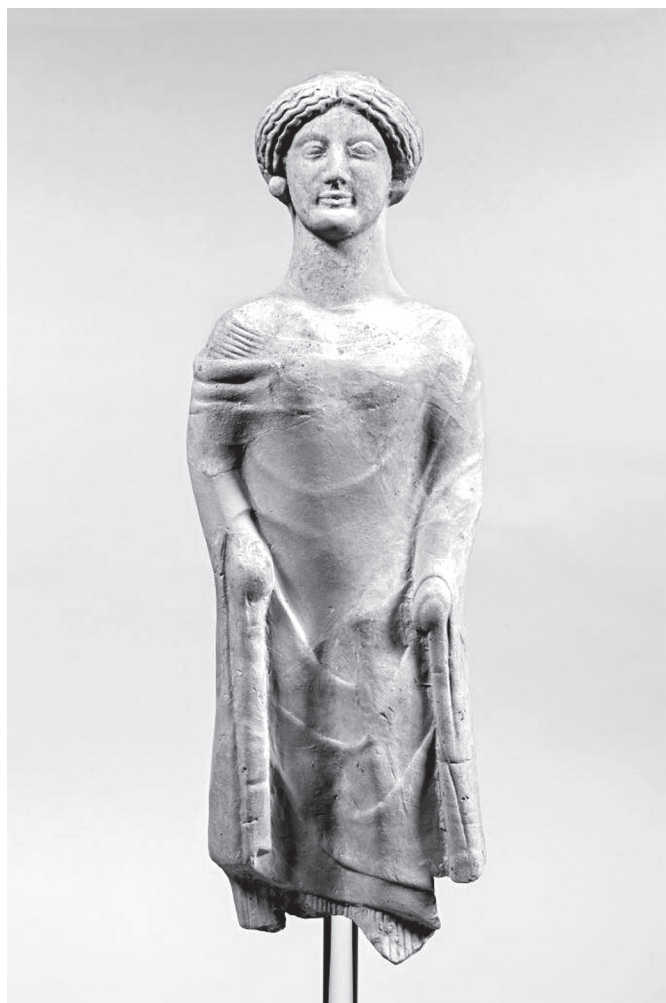
1.7. Köpenyes terrakotta nőalak Medmából, Rosarno, Museo Archeologico, inv. 3038+10729