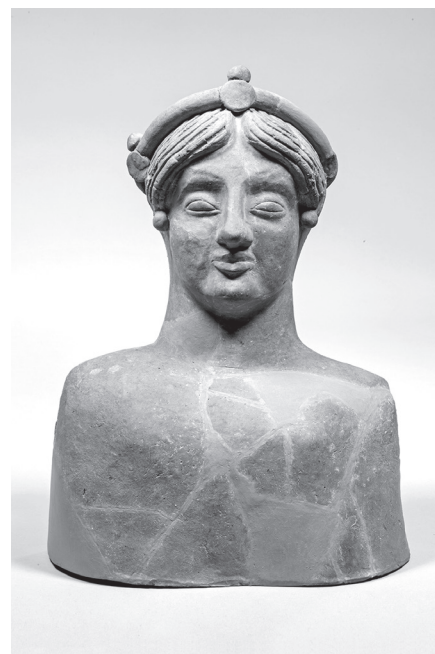
2.13–16. A rosarnói Mus. Arch. 10733 sz. terrakotta büsztjének restaurálása

4. Női büszt (ltsz. MED 2210) magasság: 310 mm Restaurátor: Csontos Katalin 2.13–16. kép