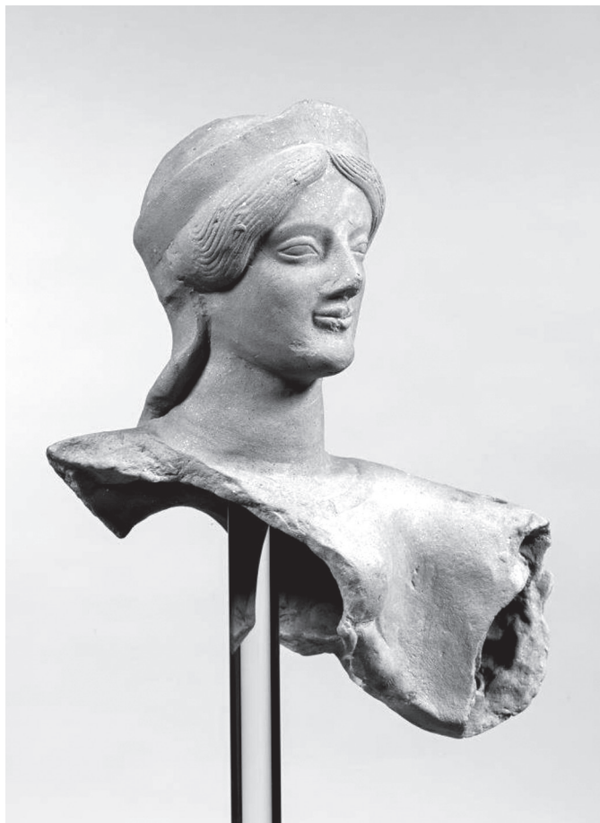
1.1. Athéna Promachos terrakottatöredéke Medmából, Rosarno, Museo Archeologico, inv. MED 2398