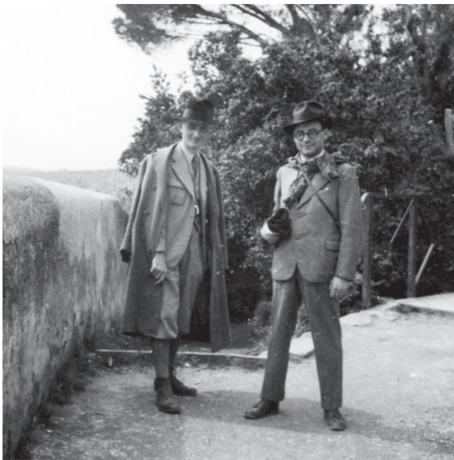
2. kép. Szerb Antal és Kerényi Károly kiránduláson, Olaszországban, 1935. Rónay László (1937–2018) közvetítésével Amerigo Tot (1909–1984) hagyatéka. PIM, F. 2636

a változás. Kerényi általában három típusú kurzust hirdetett meg minden szemeszterben: egy általános előadást ( Bevezetés az ókortudományba, Római irodalomtörténet, A görög szellem története, Görög vallás, Római vallás ), egy auctorral vagy egy problémakörrel foglalkozó szemináriumot ( Horatius, Homeros, Platon Symposion, Vergilius Aeneis VI, Hesiodos, a görög filozófia és művészet kezdetei ), végül egy szövegolvasó szemináriumot ( Antik szövegismelvények magyarázata, Görög filozófiai szövegek olvasása, Válogatott római szövegek ) és/vagy egy ókortudományi gyakorlatot. 36 Ebből is látható, hogy Kerényi a pécsi egyetemen kísérletet tett egy olyan ókortudományi szemlélet megteremtésére és művelésére, amelyben rajta kívül csak kevesen hittek, s amelyre Budapesten nem kapott lehetőséget. Akár az intézet nevének megváltoztatását, akár a kurzusösszetétel újragondolását tekintjük, a változtatások egyértelműen Kerényi tudományfelfogásával hozhatók összefüggésbe: az ókor emlékeinek összetett, nemcsak filológiai, hanem vallástörténeti, régészeti, történelmi, művészettörténeti megközelítése tükröződik benne. 37 A Tanítóképző Intézetben az Ókor-történelem és Archeológia Tanszéken meghirdetett kurzusai is erről az ókortudományi szemléletről tanúskodnak. 38 Ez részben annak az ókortörténeti tanszéknek a megvalósulása, amelynek megszervezésére Thienemann Tivadar még 1924-ben javaslatot tett a vallás- és közoktatásügyi miniszternek, s amelyre a kar meg is hívta Alföldi Andrást. A tan-