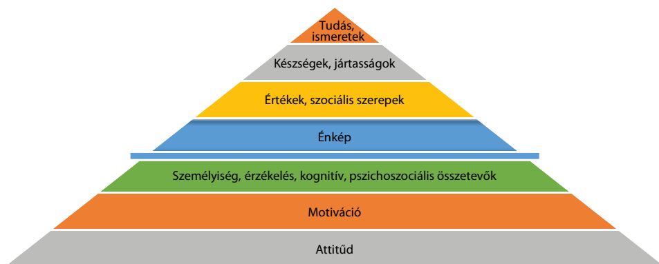
1. ábra: Kompetencia jéghegymodell

Ahogy arra a fenti fogalommeghatározások is rámutatnak, a kompetencia számos változó összessége. Ezt jól szemlélteti a kompetencia „jéghegymodellje”, amely az összetevőket két nagyobb csoportra bontja: a felszín alatti és felszín feletti rétegekre.