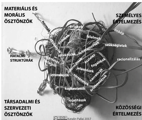
2. ábra • Integritáshoz és korrupcióhoz kapcsolható jelenségek a feszített gubanon (Forrás: Rosa el Hassán szobrának adaptációja, PALLAI: The Need for a New Expertise Profile in Anticorruption , i. m.)