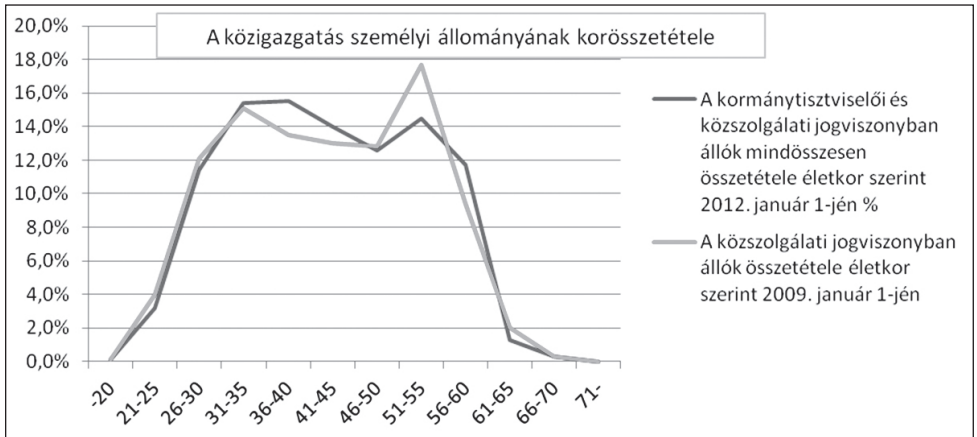
1. számú ábra • A közigazgatás személyi állományának korösszetétele 2009, 2012. Forrás: KIM

A fenti ábra a generációváltás pillanatát örökíti meg a közszolgálati jogviszonyban, a közszolgálati tisztviselők jogállásáról szóló 2011. évi CXCV. törvény hatálybalépését követően pedig a kormány-tisztviselői és köztisztviselői állományt együttesen tartalmazó foglalkoztatási kategóriában.