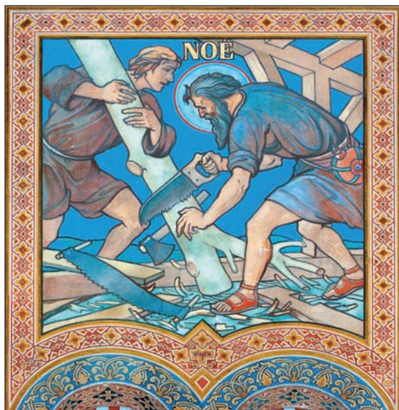
2. kép: A bárkát építő Noé. A festményt Muhits Sándor festőművész, a fotót Dusha Béla készítette.