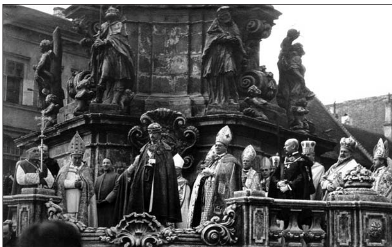
11. kép: IV. Károly király eskütétele 1916. december 30. A királytól jobbra, az ötödik főpap Glattfelder Gyula csanádi püspök.