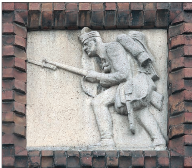
1. kép: A Nemzeti Hadsereg katonája. Mintázta Tóth István, a fotót Dusha Béla készítette.