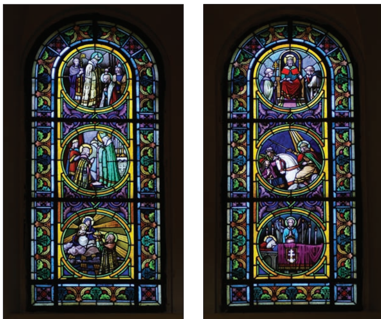
15. kép: Szent István életének jelenetei. Az ablakot Róth Miksa üvegfestő, a fotót Kisházi Gábor készítette.