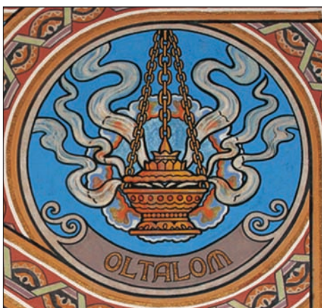
5. kép: A királyi erények motívumai, ahogyan a szentélyben egymást követik: eszme, jószág, erő, oltalom.