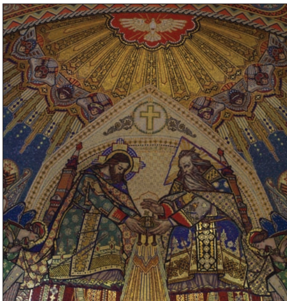
7. kép: A Teremtő és Megváltó képe az apszisban.