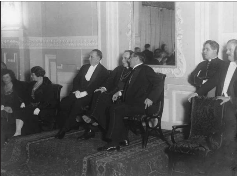
17. kép: Glattfelder Gyula püspök és Klebelsberg Kuno miniszter egy fogadáson a '20-as évek végén.