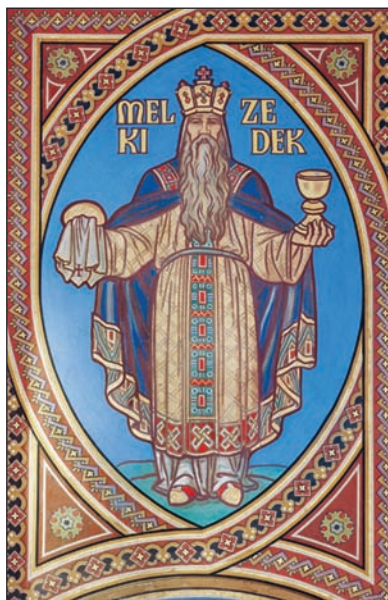
8. kép: Eszter és Melkizedek. A festményt Muhits Sándor festőművész, a fotót Dusha Béla készítette.