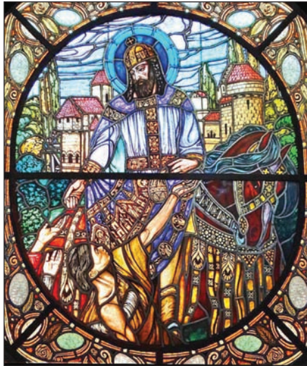
4. kép: A temesvári szeminárium Szent István királyt ábrázoló ablaka.

A festményt Muhits Sándor festőművész, a fotót Dusha Béla készítette.