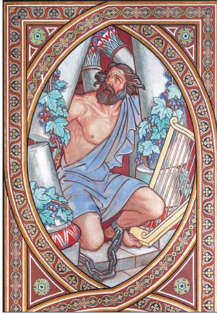
3. kép: Sámson.

A festményt Muhits Sándor festőművész, a fotót Dusha Béla készítette.