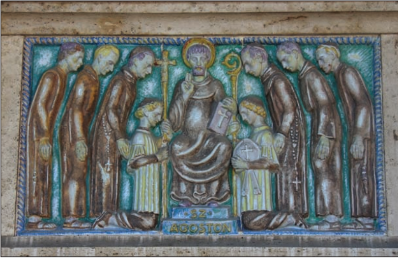
16. kép: Szent Ágoston a tanítványokkal. Készítette: Ohmann Béla szobrász.