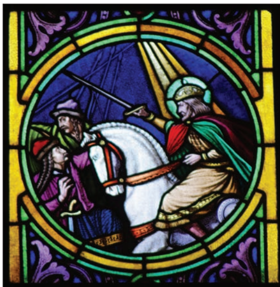
14. kép: Szent István a harcban. Az ablakot Róth Miksa üvegfestő.