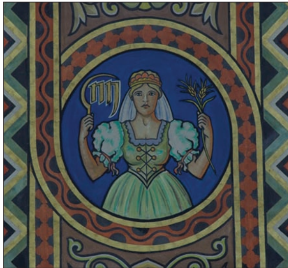
13. kép: A szűz alakja szegedi népviseletben a templom főhajójának mennyezetén.