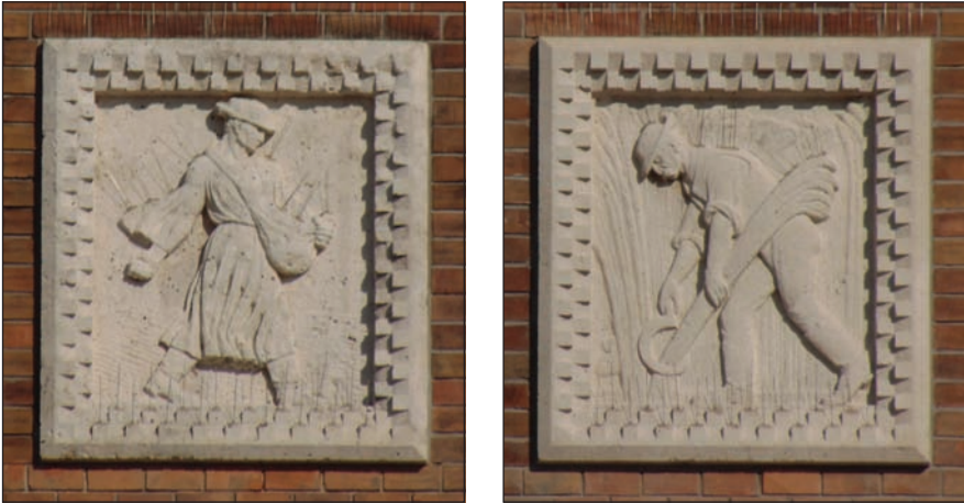
12. kép: A magvető és a sarlóval arató parasztemberek a Dóm homlokzatán.