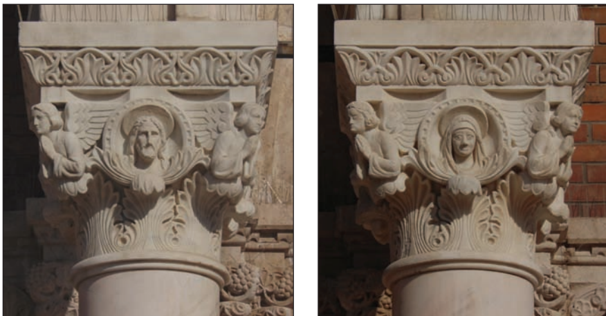
10. kép: Krisztus és Szűz Mária a Dóm bejárati oszlopfőin. A fotót a szerző készítette.