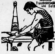
MOLL'S Fűszermesterművelő Üveg Salsz

ha mindegyik üveg Moll A. védjegyet tűntet fel és a Moll-féle sóborszesz nevezetesen mint fűszermesterművelő bedőlles-lapló bedőlles-lapló sós közszény, csúsz és a meghűlés egyéb kóvetkeményesnél legismeretesebb népsz.