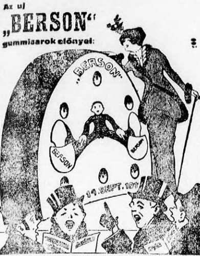
rendkívül társas kiválóan rugalmas formája ideális

* Bélyeulenyomatok a levélborítékokon. A pozsonyi kereskedelmi és iparkamara évek óta megújította a kormány előtt azt a kívánságot, hogy a kereskedelmi levelezés megkönnyítése érdekében honosítsa meg a m. kir. postánál a magánipar által előállított levélborítékoknak levelezőlapoknak, címszallagoknak póstai díjnyomattal való ellátását. A kereskedelmiügyi miniszter most arról értesíti a kamarát, hogy ennek a szolgáltatnak életbe léptetése iránt a tárgyalások annyira előrehaladtak, hogy a célzerű újítás megkezdésére ez év második felében az eddigi szerint kilátás van.