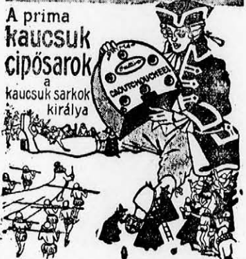
rándkívül olcsó, mert kaucsukból készült.