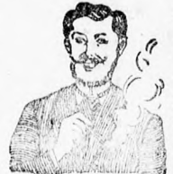
Egger-mellpasztillái csak hamar meggyógyított!