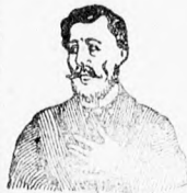
Megjött ez az átkozott köhögés!

Köhögés, rekedtség és elnyálkásodás ellen gyors és biztos hatáskú!