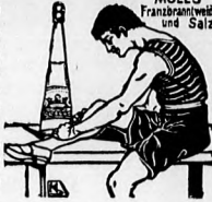
MOLL'S Franzbrunn und Salz

ha mindegyik üveg Moll A. védjegyét tünteti fel és „A Moll-féle Sós-Borszész” nevezetesen mint fűdalomeszilapító be dör zsalési szer közvény, csúsz és a meghülés egyéb kövekzetményeinél logiseretesebb népszer.