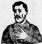
Megfogy ez az átkozott köhögés!

Köhögés, rekedtség és elnyálkásodás ellen gyors és biztos hatásúak