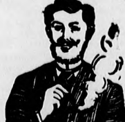
Egger-mellpasztillái csak hamar meggyógyított!