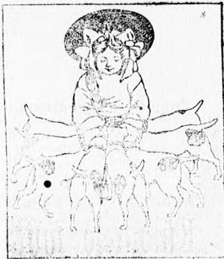
A legjobb kutyakalács volt és marad a

Fényképezési készülékek műkedvelőknek. Mindazoknak, a kik a fényképezést, e legvonzóbb és mindenki által könnyen megtanulható sport iránt érdeklődnek, ajánljuk az A. Moll cégnek (Bécs, Tuchlauben 9, es. és kir. udv. sz. 110) 1854 óta fennálló fényképezési eszközök különlegességnek áruházát, amelynek képes árjegyzékét kívánatra szívesen küld el bérmentve a cég.