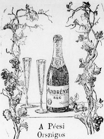
A Pécsi Országos

Kiállításon legmagasabb kitünteté- st, diszoklevelet nyert.