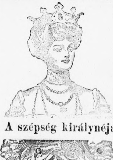
A szépség királynéja