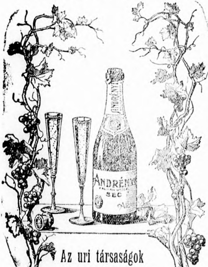
Az uri társaságok