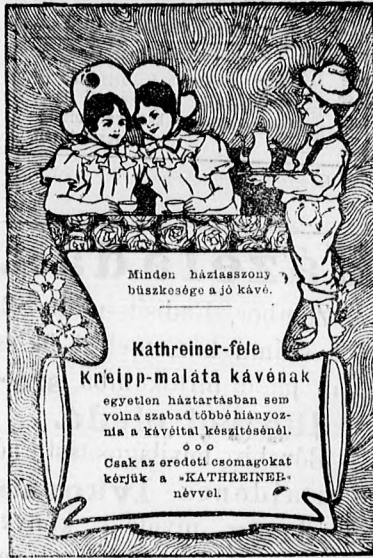
Fig. 16. 1905.

* Az árufelvétel megkezdése a hajóállomásokon. Az Első es. kir. szob. Dunagőzhajózási Társaság ezennel kezdbre teszi hogy folyó évi márczius hó 4-én az árufelvétel az összes társulati hajóállomásokon egymásközi forgalmában — a mennyiben eddig még meg nem történt — megkezdik. Az áruszállító-hajók menetrendjét és a társulati állomások növényezékét kívánatja ingyen kiszolgáltattják.