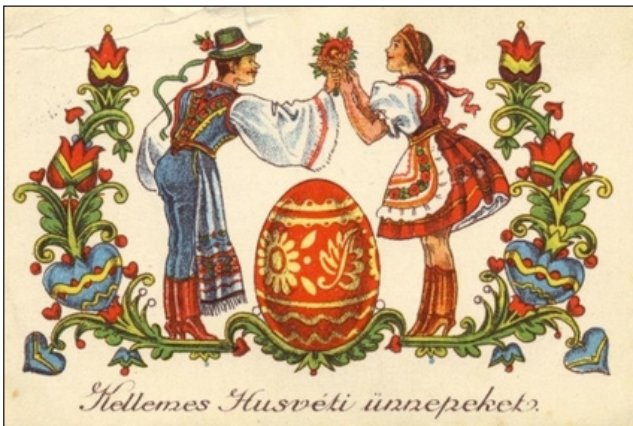
Hellemes Húsvéti ünnepek.

HÚSVÉTVASÁRNAP – A feltámadás vasárnapja, a keresztények a feltámadt Krisztust ünneplik. Ehhez a naphoz tartozott az ételszentelés hagyománya. A X. század óta ismeretes szertartás Húsvét vasárnapján a húsvéti ételek, sonka, bárány, kalács, tojás, bor megszentelése a templomban.