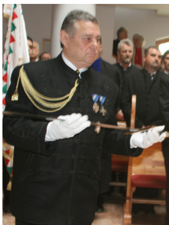
Vitézavatás a Millennium, vagy Angyalos templomban, Csíkszereda

Gyerekkorom emlékei az időteltével egyre gyakrabban jutnak eszembe, főleg az ötvenes évek adventjei. Eszembe jut, elemistaként a reggeli koránkelés, mikor legkésőbb 5,30 órakor a 6 órás ro-rátéra indultunk, majd a szentmise után a szomszéd faluban lévő 5-8 osztályos elemi iskolába igyekeztünk.