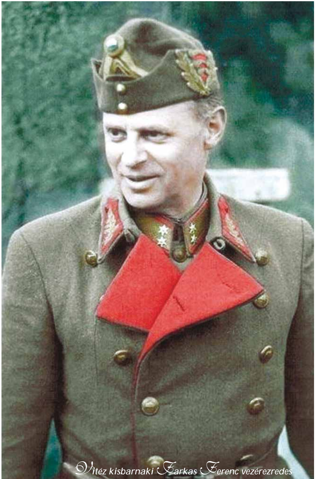
Vitéz kisbarnaki Barkas Ferenc vezérezredes