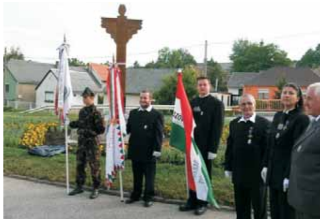
Díszőrség a Trianon keresztnél

kórus előadásában csángó népdalokat hallgathattunk. A megemlékezés koszorúzással folytatódott. Koszorút helyezt el az emlékműnél a Történelmi Vitézi Rend, a Hosszúhetényi Önkormányzat, a Pécs-Baranyai 56-os Szövetség, az 1848-'56-os alapokon nyugvó Baranya megyei Nemzetőrség, a Komlói Erdélyi Kör, Vasasi Szent Borbála Egyesület, valamint az ünnepségen résztvevő személyek.