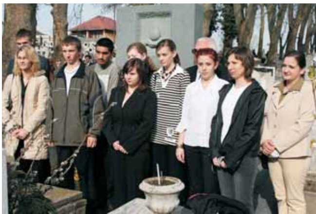
A záhonyi diákok is lerótták kegyeletüket