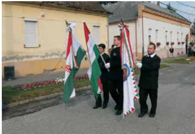
A zászlók bevonulása

... De hirdessük gúzsba kötött kézzel Sebes ajkkal, lázadó vérrrel Idézve menny, pokol hatalmait Hogy béke nincs, hogy béke nincsen itt. Kezüink bár nem pihen a kardvason A szíveinkben nem lesz nyugalom.