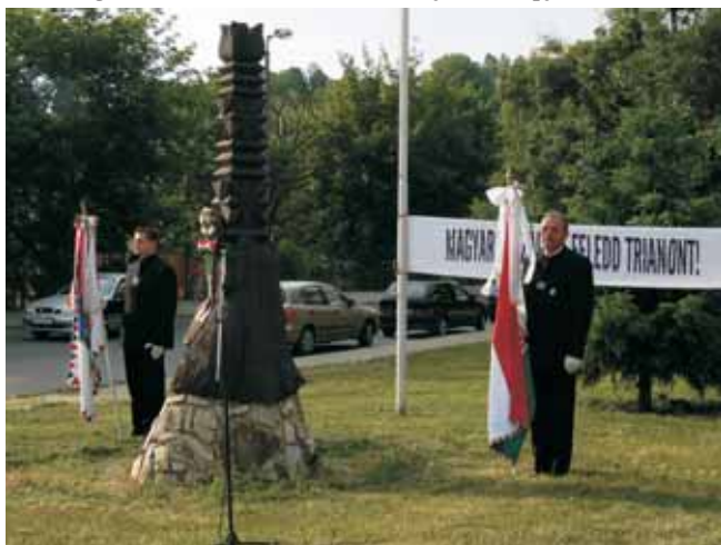
Díszórség a Történelmi Vitézi Rend zászlójával a kopjafánál

eseményéről. A Történelmi Vitézi Rend Dél-Dunántúli törzsszék állománya meghívást kapott az ünnepi megemlékezésen való részvételre. Állományunk tagjai koszorút helyeztek el a Történelmi Vitézi Rend nevében a kopjafánál. A Szózat és a Székely Himnusz eléneklésével fejeződött be a megemlékezés.