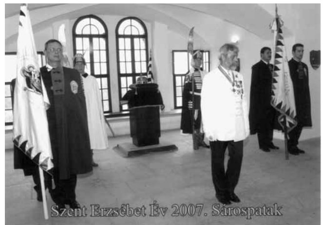
Szent Erzsébet Év 2007. Sárospatak