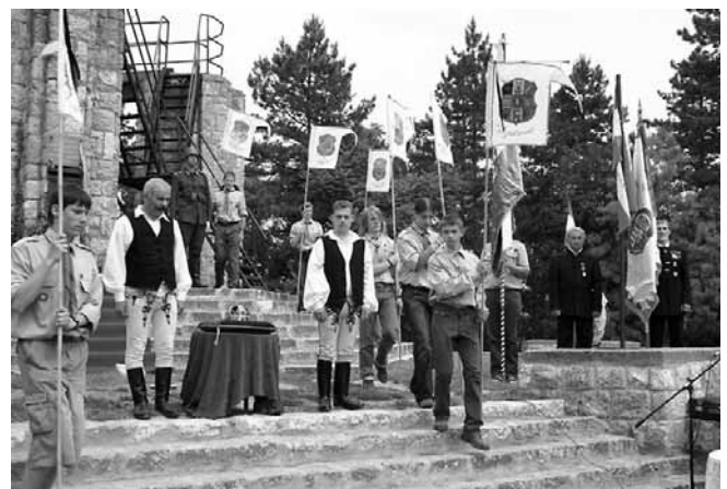
Díszórség a Szent Korona másolatának