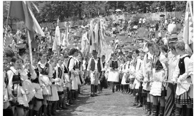
Székely fiatalok sora között érkeznek a zarándokok a mogyoródi fa-ragott kereszttel, melyen minden szalag egy-egy települést jelent