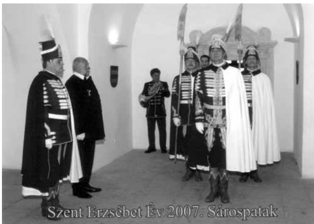
Szent Erzsébet Év 2007. Sárospatak