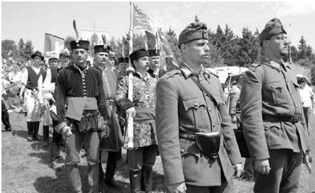
Hagyományörzők korhű egyenruhákban

közös múltat megismernék azok kései utódai is, akik „a kezdeti szeretettől” Buda elfoglalása után eltértek (vö. Jel 2,4). Az első félvezredben megélt Krisztusi egysé-günket kellene minden jó-akarátú embernek megélnie. Akkor a szétdarabolt nem-zettest tagjai elfogadják egy-mást és egyéforrnak. Szent István alapította Erdélyi püspökség ezer éve vissza-nemterő alkalom arra, hogy atyáink hűségével szolgáljuk