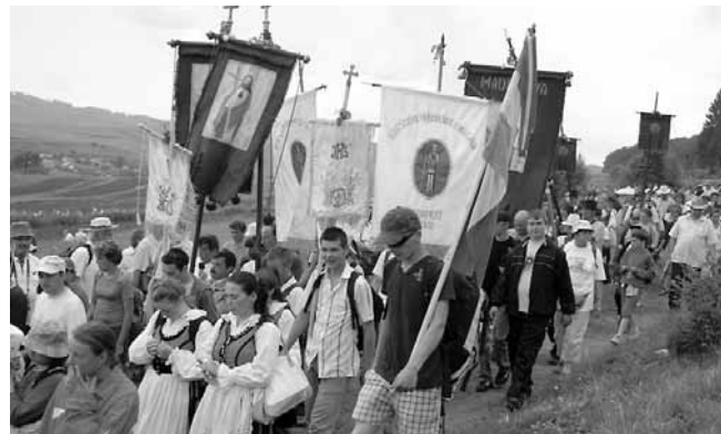
Keresztalják hazafelé indulnak

Máriához jövünk megkö-szönni a Szent István alapí-totta (1009) Erdélyi Püspök-ség 1000 esztendejét. Az el-telt 1000 évből 550 közös volt a reformátusok, az evangéli-kusok, és az unitáriusok ősei-vel. Gazdagító lenne, ha azt a