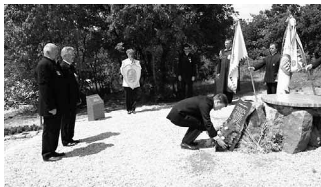
A magyar békefenntartók emlékművénel

Szóba került, hogy egy, az 1956-os forradalom és szabadságharc hőseihez is méltó emlékmű állítása is lehetséges e nemzeti emlékhely-sorban.