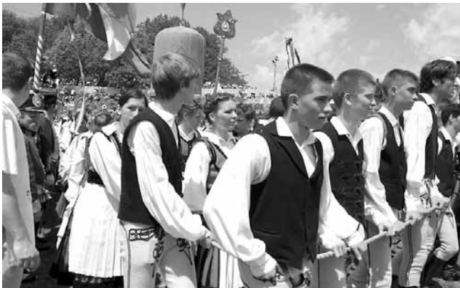
A kordon a labarummal. A legkiválóbb székely diákok kiváltsága: a Kegyetemplomból a Somlyó-heggyre felvinni az ősi szimbólumot