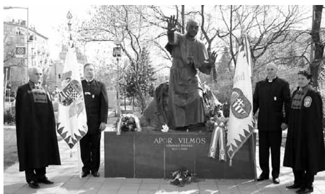
Boldog Apor Vilmos emlékműve, Budapest, III. ker. Díszörséget ad a Történelmi Vitézi Rend