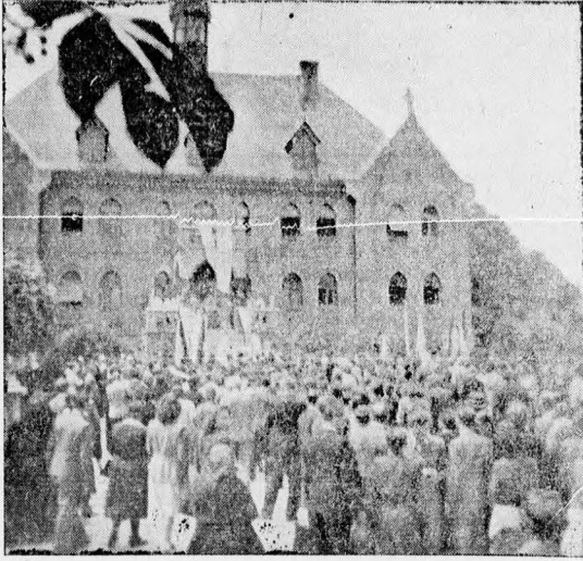
„Bemegyek az Úr oltárához...”

Június 18-án Jézus Szíve vasárnapján lélekemelő testvéri találkozóra és zarándoklatra jöttek össze Máriairemetén a Központi és pestkörnyéki egyletek. Bennünket, magyarokat mindig segítő Nagy-