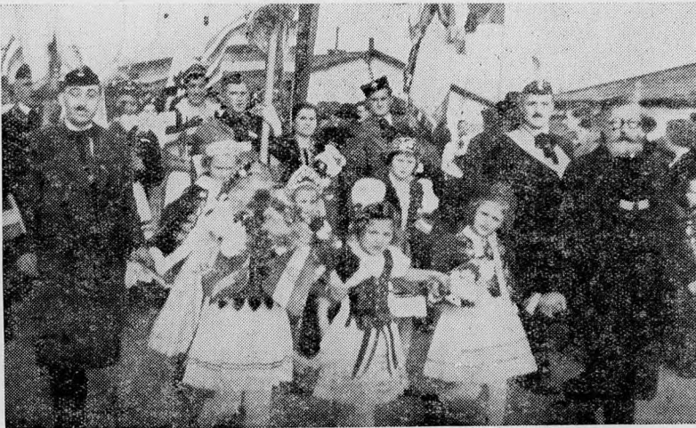
Igy fogadta a kassai egylet a magyar testvéreket.

A legnagyobb hajszát nem a csehek folytatták ellenünk, hanem a szlovákok. A cseh rendőrigazgatók szerint már a multban levizsgázott rendőrkapacitások voltak, akik nem igen tartották önmagukhoz méltónak, hogy egy senkinek sem ártó, csak élni akaró magyar egyesületnek a föld színéről való eltüntetésével szerezzenek további karrierjükhöz érdemeket. Nem így azonban pl. Stefánik szlovák rendőrigazgató úr , akinek éreje a legszomorúbb emlékeket idézi fel Kassa magyar kultúregyesületeiben. Ez az úr olyan eszközöket vett igénybe velünk szemben , amelyek az őszinte és nyílt magyar jellem szemében — a legenyhébben szólva — hítvány eszközök s egy rendőrigazgatóhoz teljesen méltatlanok. (Esetekkel az érdeklődőknek szívesen szolgálók.) És ha mégis, az ő lelke mélyén is szunyadvó emberi érzéstől indítatva nyujtani akart volna nekünk annyit, amennyi minket a fennálló jog alapján föltétlenül megilletett, megakadályozta őt ebben a háta mögött álló szlovák kultúr-kamarilla , amely éberem vigyá-