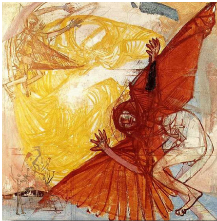
A bukott angyal