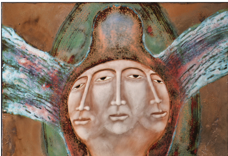
GONDOLATOK A TEREMTÉS RŐL tűzzománc 28x41 cm