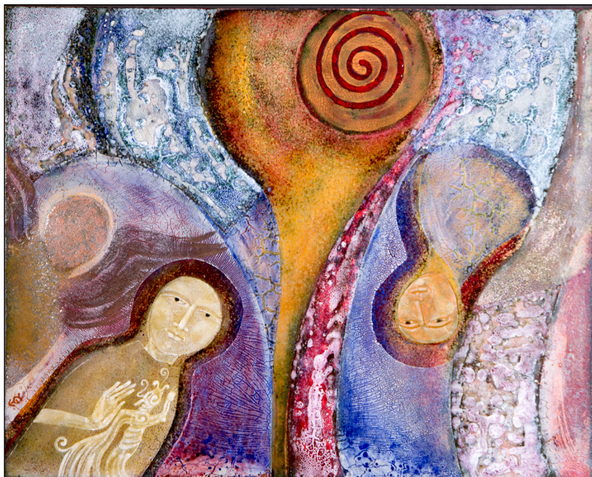
ANGYALOK tűzzománccal 35x51 cm

1990 óta rendszeres résztvevője a kecskeméti Nemzetközi Zománcművészeti Alkotótelepnek, illetve ösztöndíjasként az Alkotóműhelynek.