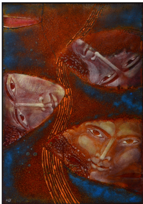
GONDOLATOK A LÉTRŐL tűzzománc 41x28 cm