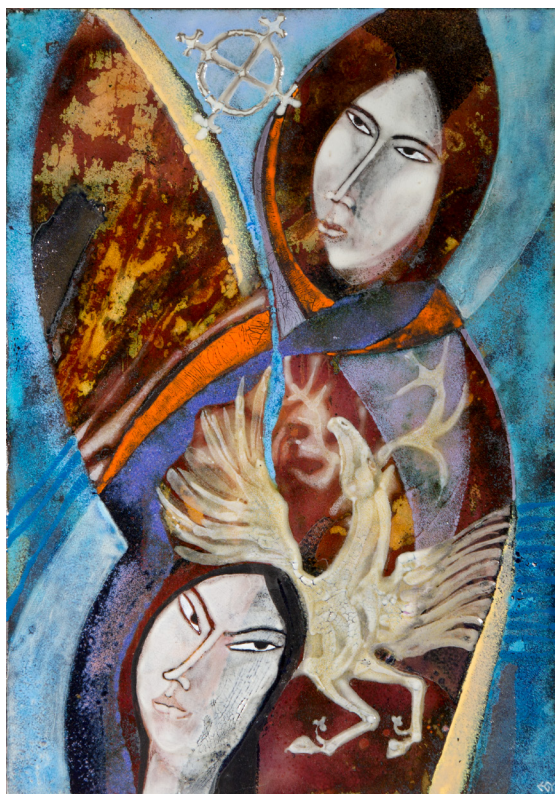
SZÁRNYAS LÓ tüzzománc 40x28 cm

Zománcművein szülőföldjének, a Székelyföld népművészetének (festett kazettás mennyezetek, székelykapuk) motívumvilágát és annak szimbolikus tartalmait dolgozza fel, értelmezi újra. Munkái magasfokú iparművészeti igényességet tükröznek, a különféle technikák (festett zománc, rekeszománc, sodronyzománc) alkalmazása gyakran társul a szabadon maradt vörösréz recipiens aranyozásával vagy polírozásával, ill. egyes alkotásokon applikációkkal (fémek, drágakövek). Tüzzománcozást oktat Székelyudvarhelyen, alkalomszerűen Soltvadkerten, Kiskőrösön, Keszthelyen, La Corunaban és Bécsben.