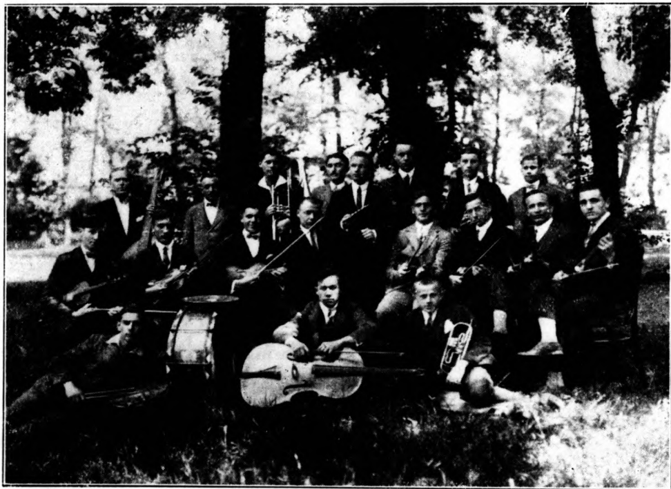
A Don Boso Kör zenekara.

Don Bosco Kör. Mint általában a szalézi művek, úgy a Don Bosco Kör is rohamosan fejlődött. Csekély három éves működése alatt tagjai anynyira megszapordtak, hogy eddigi helyiségük kicsinynek bizonyult s így