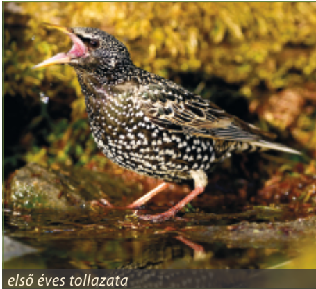
első éves tollazata