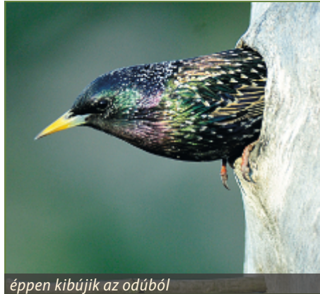
éppen kibújik az odúból