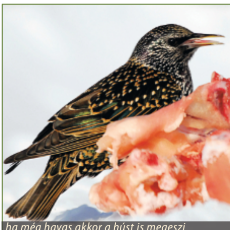
ha még havas akkor a húst is megeszi