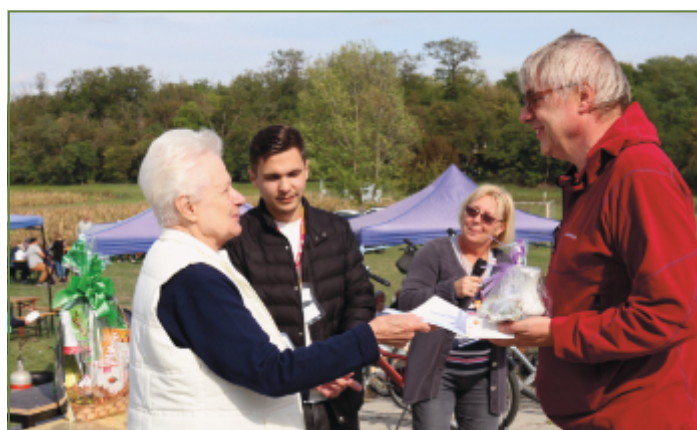
További fotók a hátsó borítón