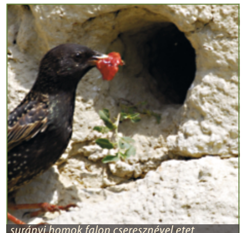
surányi homok falon cseresznyével etet