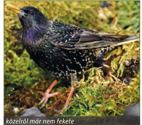
közletről már nem fekete

Ha a naptárba tekintek, amelyről október lévén sok minden jut eszembe, többek között az, hogy benne vagyunk a szőlő szüretben és a szőlős gazdák aggódva kémlelik az eget. Ennek oka, hogy az idén is a fiatal seregélyek a szülő madarakkal együtt gyakran népes csapatokba tömörültek, és valamennyien nagyon szeretik a szőlőt.