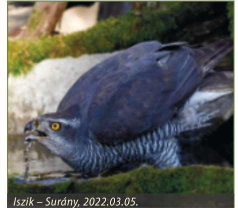
Iszik – Surány, 2022.03.05.

Környékünk és lakóhelyünk egyik neves képviselője a héja. Termete, és életmódja alapján, nem lehet a nehezen látható és felismerhető madárfajok közé sorolni. Azonban érdekes statisztikai adat lenne, hogy a saját településünk, de akár vehetjük a szigetünkön fekvő négy települést, és Leányfalut is együtt hogy az itt élő lakosok közül hányan látták, és tudnak a jelenlétéről és költéseiről? Tehát mégis egy rejtett életmódú, szép és védett madárfaj.