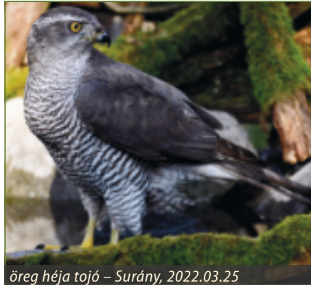
öreg héja tojó – Surány, 2022.03.25