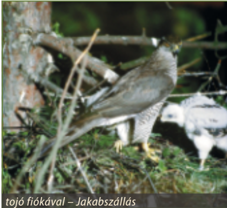
tójó fiókával – Jakabszállás