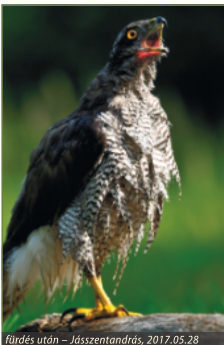
fürdés után – Jásszentandrás, 2017.05.28