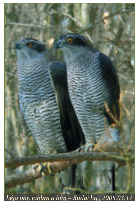
héja pár, jobbra a hím –, 2005.03.17