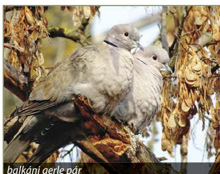
balkáni gerle pár