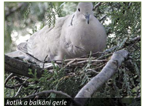
kotlik a balkáni gerle

A balkáni gerle az egyik legközönségesebb madarunk, télen-nyáron velünk van falun-városon egyaránt. De ez nem volt mindig így, mivel ez a vadgalamb faj csak a 20. század elején-közepén kezdett terjeszkedni Európában. Eredetileg Hátsó-Indiától Kis-Ázsiáig költött. Magyarországon 1926-ban észlelték először Tiszaugon. A Balkán-félsziget felől terjeszkedett ÉNy-i irányba, innen kapta a nevét is. Ma már Angliában és a Skandináv félsziget déli részén is költ. Kultúrákövető faj, vagyis az emberi településeket foglalta el, ahonnan kiszorította közeli rokonát, a vadgerlét.