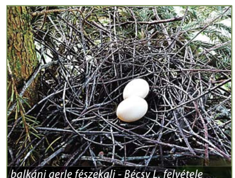
balkáni gerle fészkek alj