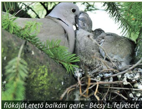
fiókáját etető balkáni gerle