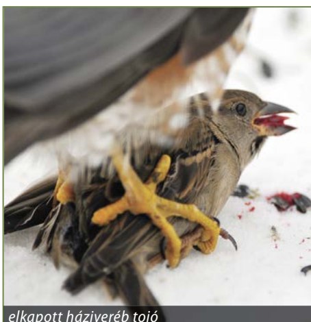
elkapott háziveréb tojó