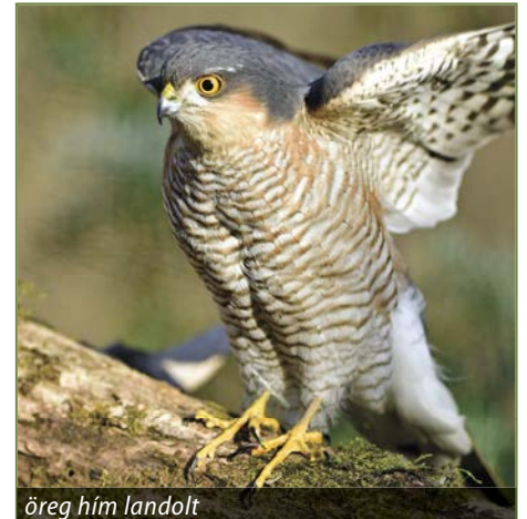
öreg hím landolt

A karvaly – egy a nála talán közismertebb – vércséhez hasonló méretű, de csendes, rejtett életmódja miatt nehezebben észrevehető, gyakori ragadozó madár. Európában Magyarországon és itt Pócsmegyeren is él, költ, és nagyon kultúrákövető faj. Már akár kertekben, kisebb facsoportokban, arborétumokban vagy városokban is megtelepedik, ahol vannak fák, és naponta elfogja majd elfogyasztja a kisebb énekes madarakat. A fa vagy erdő nélküli élőhelyeken ritkán fordul elő.