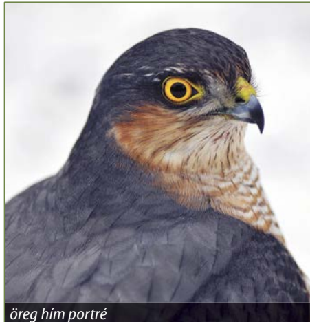
öreg hím portré