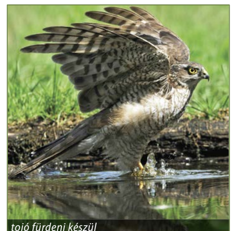
tojó fürdeni készül