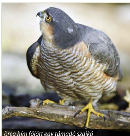
öreg hím fölött egy támadó szajkó