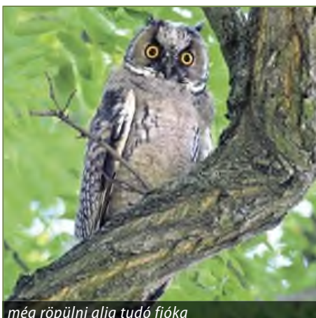
még röpködni alig tudó fióka