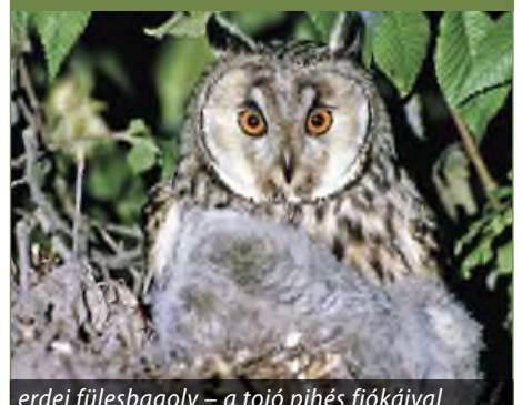
erdei fülesbagoly – a tojó pihés fiókáival