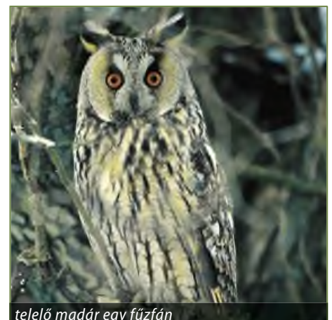
telelő madár egy fűzfán