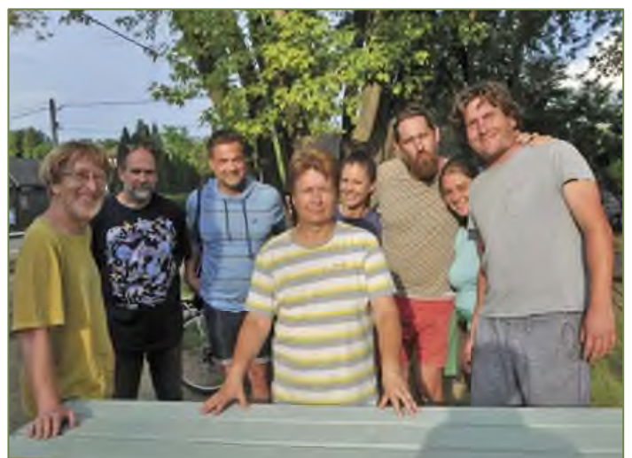
A Köszí, önkéntesek csapata a Napsugár téren az új asztalokkal