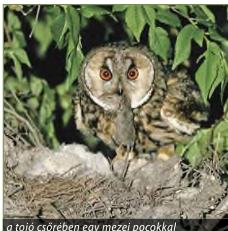
a tojó csőrében egy mezei pocokkal