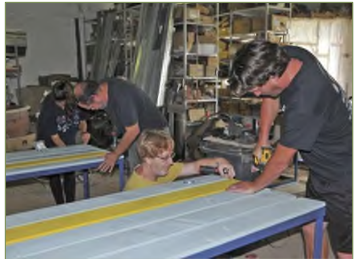
Az asztalok összeszerelése