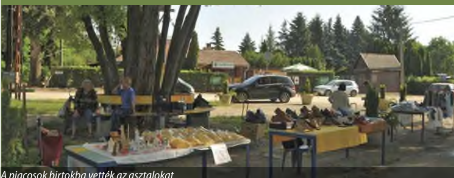
A piacosok birtokba vették az asztalokat