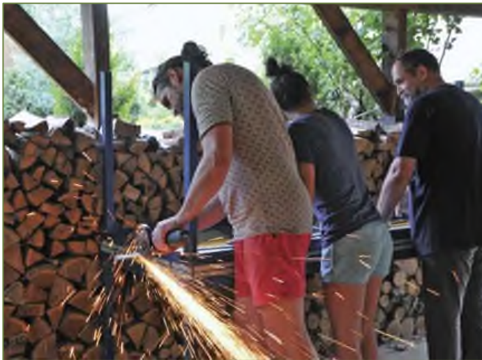
Készül az asztalláb