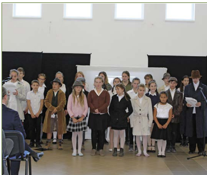
Október 23.-i ünnepi megemlékezés : Zöldsziget Körzeti Általános Iskola tanulói