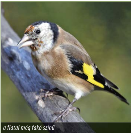
a fiatal még fakó színű