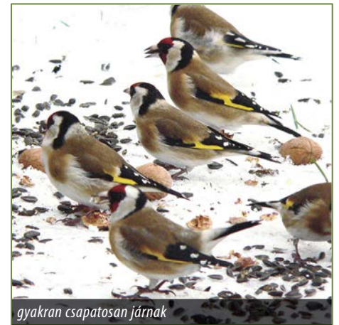
gyakran csapatosan járnak