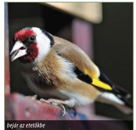
bejár az etetőbe