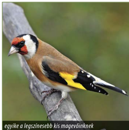
egyike a legszínesebb kis mavevőinknek