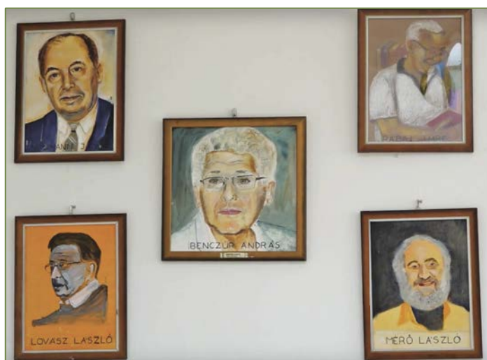
képek a kiállításról