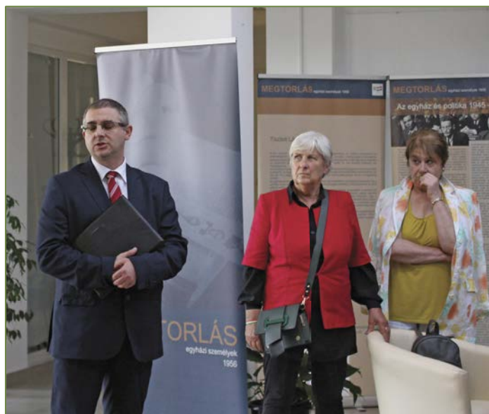
Október 23.-i ünnepi megemlékezés: Kiállítás „Megtorlás - Egyházi személyek 1956”