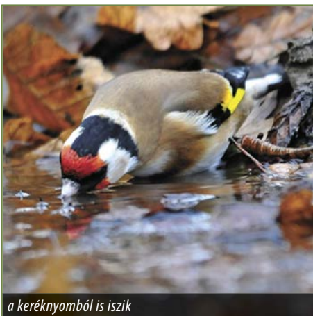
a keréknyomból is iszik