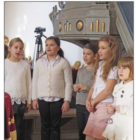
A 2. osztályos lányok