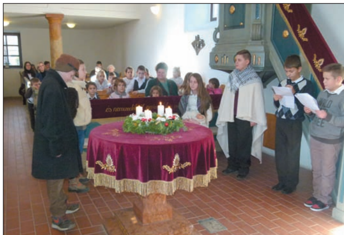
Gyermekek karácsonyi istentisztelet 2014