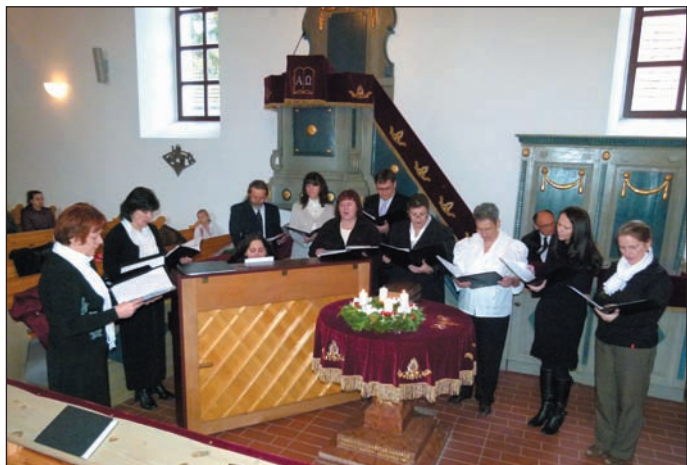
Sziget Hangja 2014. december 13.