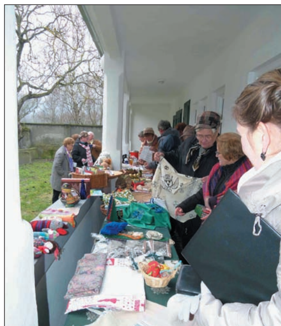
Adventi vásár 2014. december