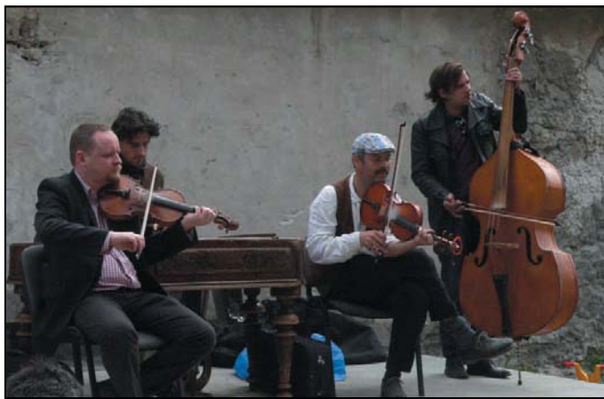
A Kerek zenekar