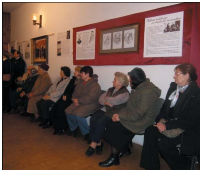
500 éve született Kálvin János emlékkiállítás a Művelődési házban 2009-ben.