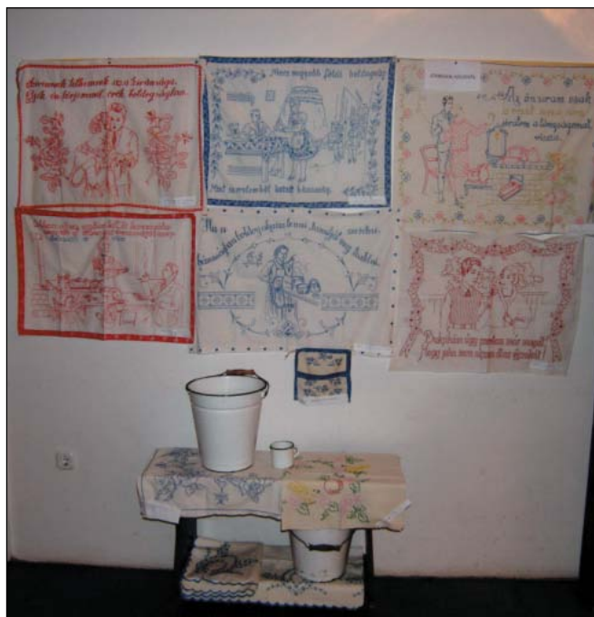
Falterítő kiállítás 2009-ben a Művelődési házban