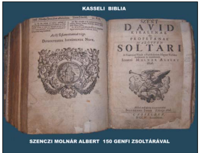
2008-ban Biblia kiállítás a református templomban.