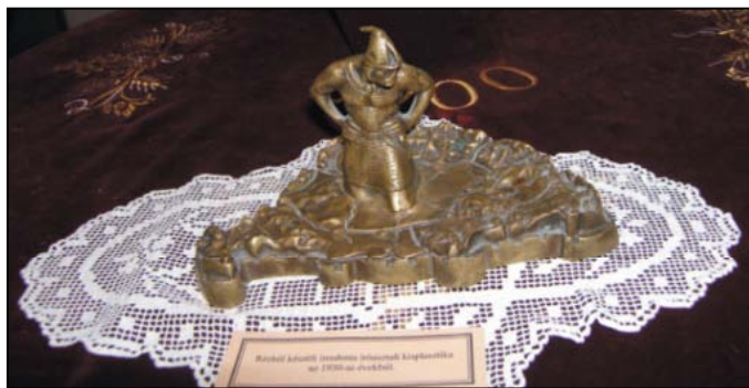
„Emlékezünk a Trianoni békekötésre” kiállítás a református templomban 2010-ben.

Igyekeztem egy kis áttekintést adni az elmúlt 10 év kiállításai- ból a teljesség igénye nélkül a rendelkezésemre álló archívum képeiből. Az áttekintés következő számunkban folytatódik!