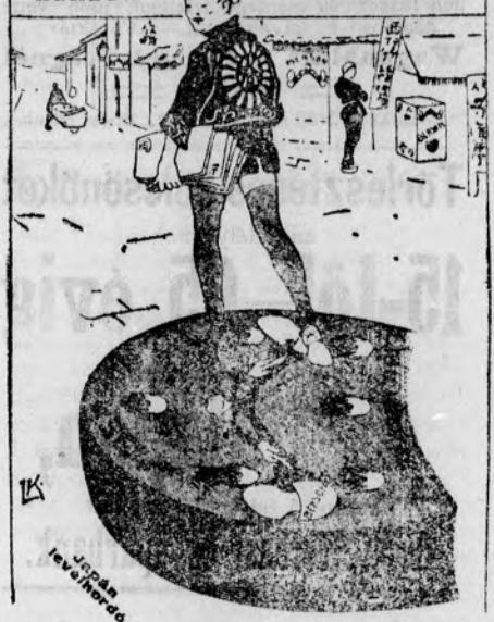
Japán levélhordó. Fegyvere taposás, kikiáltás, fáradság, az idegek rázkóztatása kizárva! BERSONTÖVEK, Budapest, VII.

azonnal fellelmerre az ÚJ BERSON HUMNIBAROK számos előnyét!