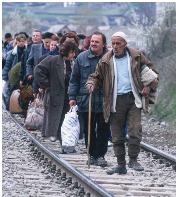
Koszovói menekültek 1999 áprilisában Dél-Szerbiában. Az ENSZ nem adott felhatalmazást a NATO beavatkozására a koszovói albánok elleni szerb támadások után, és ez megmérgezte a viszonyt Oroszországgal