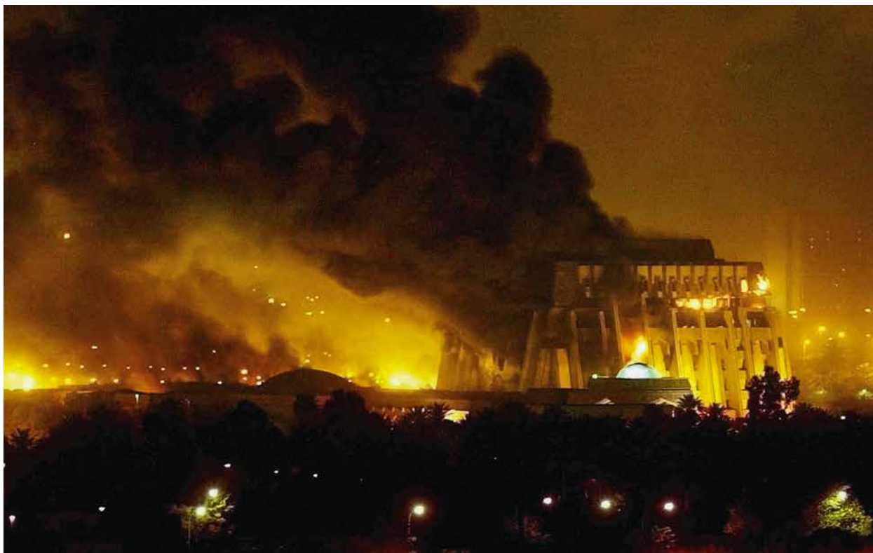
Füstbe és lángokba borult bagdadi épületek az Egyesült Államok iraki főváros elleni légitámadását követően, 2003 márciusában. Az Amerika vezette iraki invázió 2003-ban megdöntötte Szaddám Huszein rezsimjét, amit egy évig tartó erőszak, nyugtalanság és polgárháború követett