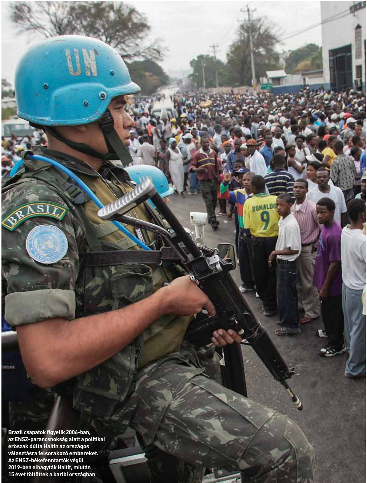
Brazil csapatok figyelik 2006-ban, az ENSZ-parancsnokság alatt a politikai erőszak dúlta Haitin az országos választásra felsorakozó embereket. Az ENSZ-békefenntartók végül 2019-ben elhagyták Haitit, miután 15 évet töltöttek a karibi országban