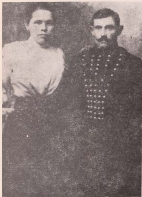
Uradalmi parádés kocsis

A konvencióban szerepelt még a magdisznótartás a szaporulatával együtt. Ez nem azt jelentette, hogy az uradalom tartotta a kocákat, hanem azt, hogy az anyadisznóval együtt a néhány malacát vagy süldőjét is kihajthatta az uradalom esordájába, amelyet a gazdaság által fizetett kanász őrzött.