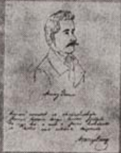
Handwritten text, possibly a signature or title.