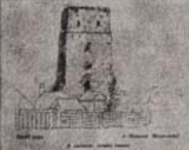
Handwritten text, possibly a title or description.