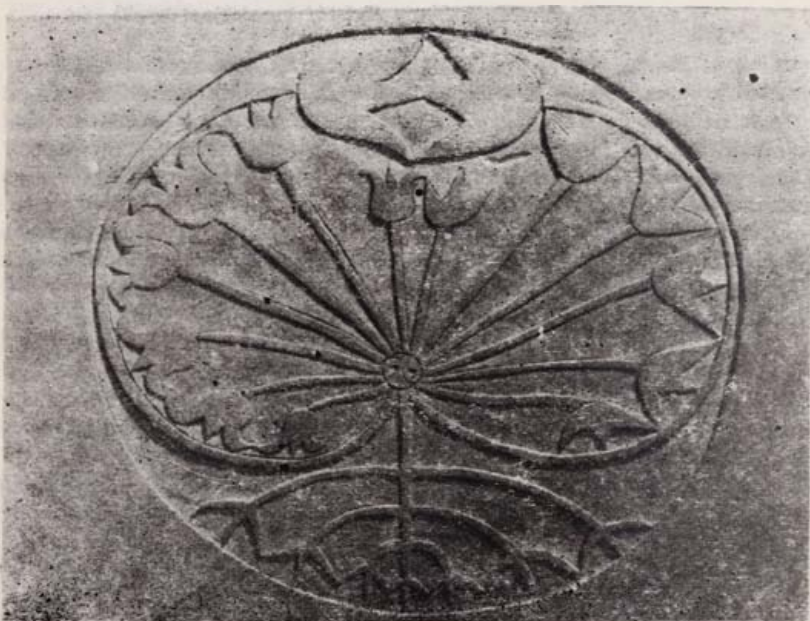
„Családfa”. Faragott böleső dísztáblája ( Nagy Kristóf alkotása)

Az 1972–73-as első munkaév utolsó stúdió-foglalkozása, úgy érezzük, lezárta a most bemutatott kezdeményezés első szakaszát, s egyúttal megteremtette a további fejlődés feltételeit. Akkor, 1973. május 20-án, a Népművelési Intézet védőszárnyai alatt alapszabályszerűen is megalakult a Fiatalok Népművészeti Stúdiója, a népi hagyományokra épülő műve-