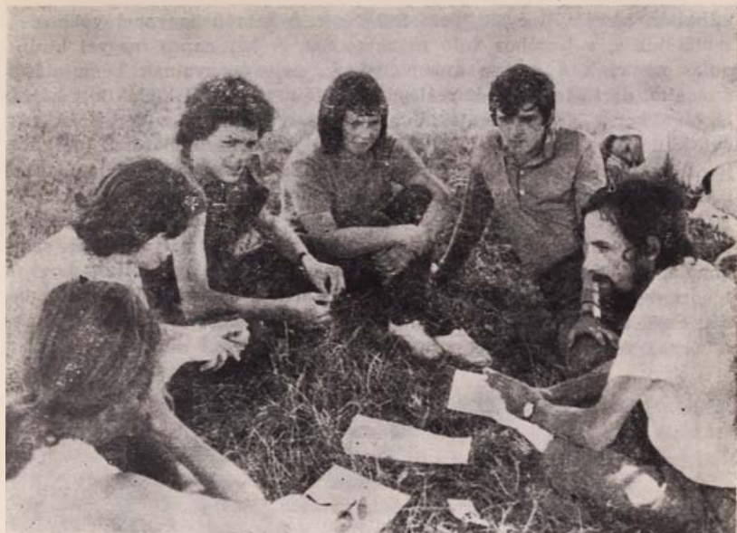
A tájékozási verseny egyik állomásán: kérdés-felelet megyeismeretből

Turistvándiban Móricz Zsigmondra , a másik Tiszabecsen Szabó Lőrinc re vonatkozó hagyományokat gyűjtött. A fiatalok közelebb kerültek a két alkotó életművének megértéséhez, és újabb adatokkal gazdagították a Móricz , illetve a Szabó Lőrinc filológiát. (Pályamunkájuk: Móricz Zsigmond a szatmári nép emlékezetében; Szabó Lőrinc a szatmári nép emlékezetében).