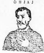
megfojt ez az átkozott KÖHÖGÉSI!

Dr. Keleti és Murányi vegyészeti gyára Ujpesten. II.