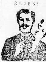
EGGER-mellpasztilla csakhamar meggyógyított!

EGGER MELLPASZTILLAI, az étvágyat nem romlítja és kitűnő ízűek. Doboza 1 és 2 korona. Próbadoz 50 fillér. Kapható gyógyszerárak, és drogeriákban. Gyár és szétküldési hely: Egger A. Fia.