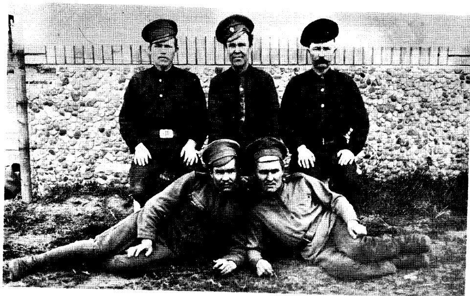
Beke Ödön nyelvmesterei