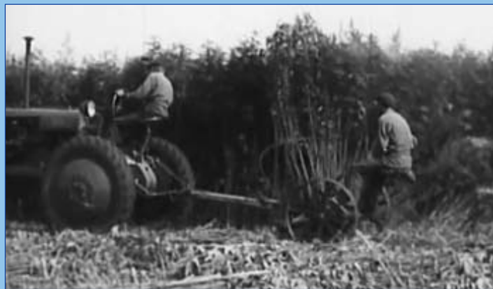
Aratják a kendert