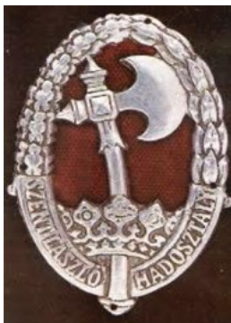
A Szent László Hadosztály csapatjelvénye

Az új hadosztály a legnagyobb harcértékű alakulatokból épült fel, melyet az arcvonalból kivont 1. ejtőernyős ezred, a kiképző ezred (mely időközben a hídfőharcokban felörlődött, pótlására a testőrségből és a testőr lövész zászlóaljból alakított gránátos