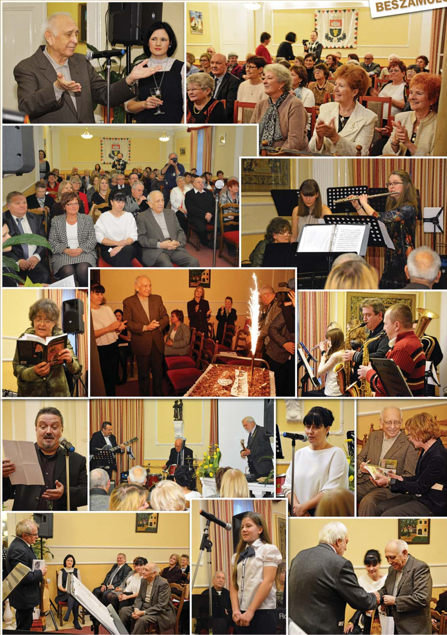
A rendezvényről készített bővebb képes beszámolókat megtekinthetik a www.pilis.hu és Pilis Város facebook oldalán.